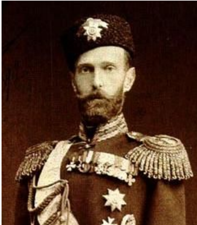
Великий князь Сергей Александровича

При поддержке московского генерал-губернатора Великого князя Сергея Александровича в Москве были созданы легальные профсоюзы .