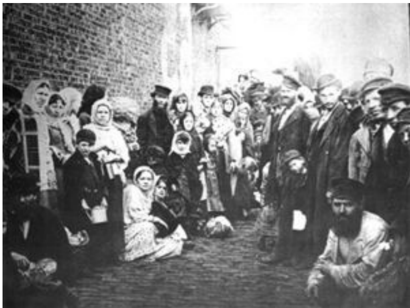
Еврейские беженцы из России

В области национальной политике Николай начал наступление на национальные области. В 1899-1901 гг. были ограничены права финского сейма , финны начинали служить в русской армии на общих условиях, делопроизводство (как и в Польше) должно было вестись на русском языке.