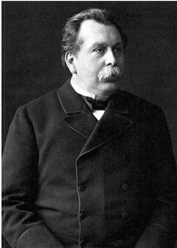
Плеве Вячеслав Константинович

Оппонентом Витте стал Министр внутренних дел В. К.Плеве . Он полагал, что у России своя история и свой социальный строй.