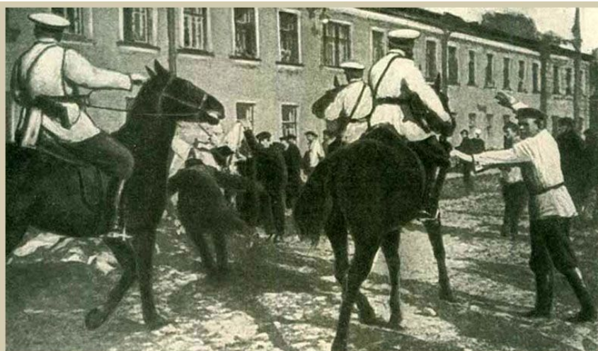
Разгром полицией бастующих рабочих Обуховского завода 7 мая 1901 года.

Николай издал указ о скорых преобразованиях, но до реальных мер дело не дошло.