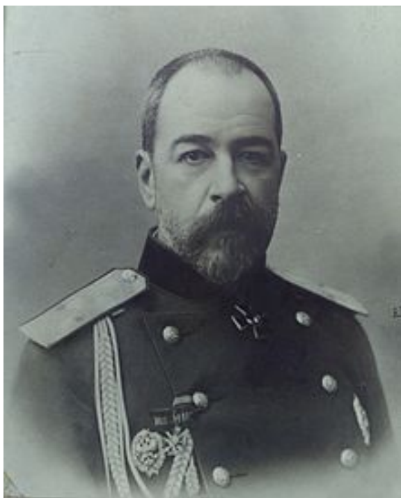
Святополк-Мирский Петр Дмитриевич

Ситуация в стране продолжала обостряться под влиянием экономического кризиса и поражений в Русско-японской войне.