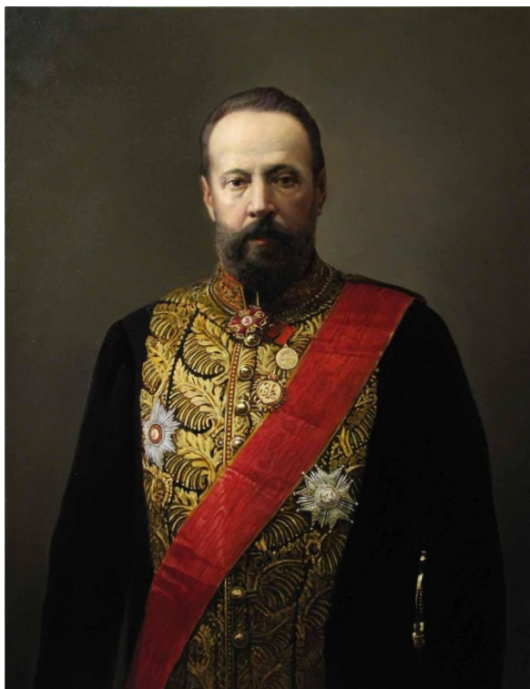
Витте Сергей Юльевич

За влияние на царя шла борьба либералов и консерваторов .