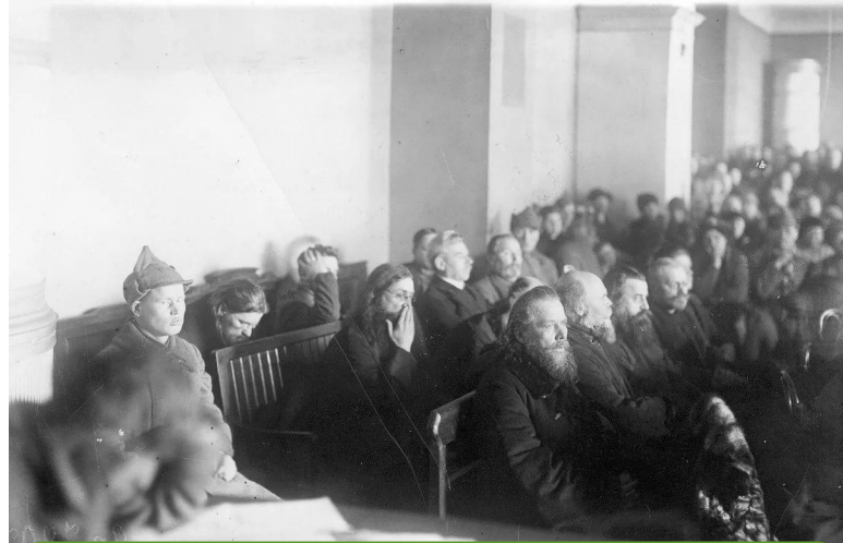
Суд над духовенством, 1922г.