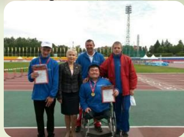
18 кратная паралимпийская чемпионка Рима Баталова, Чебоксары