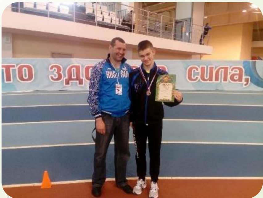
Спорт Пода Новочебоксарск