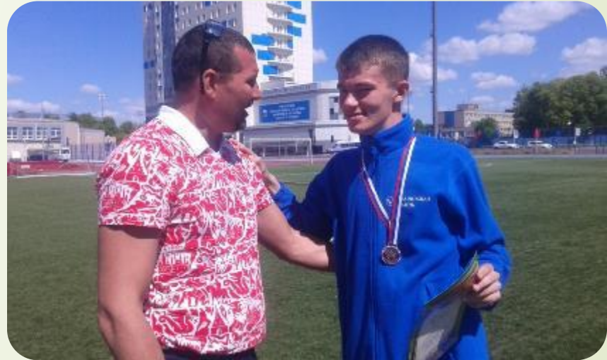
Спорт ПОДА, Смоленск