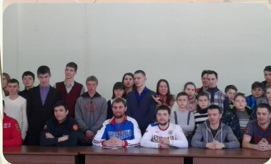
Дружеская встреча с паралимпийцами

7 сентября 21:03 / Центр внимания / Олимпиада / дети ☆☆☆☆☆