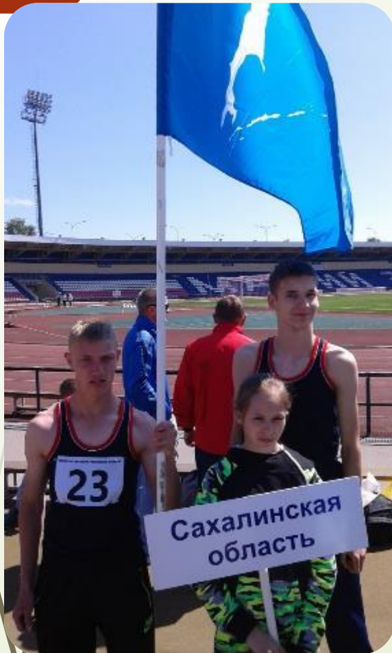
Спорт ЛИН Йошкар-ола