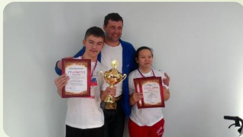
Чемпионат ДФО по бочче, Хабаровск