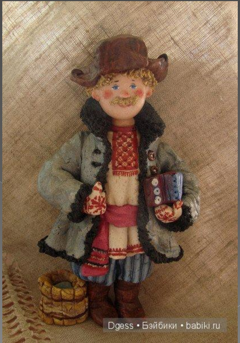
Dgess • Бэйбики • babiki.ru