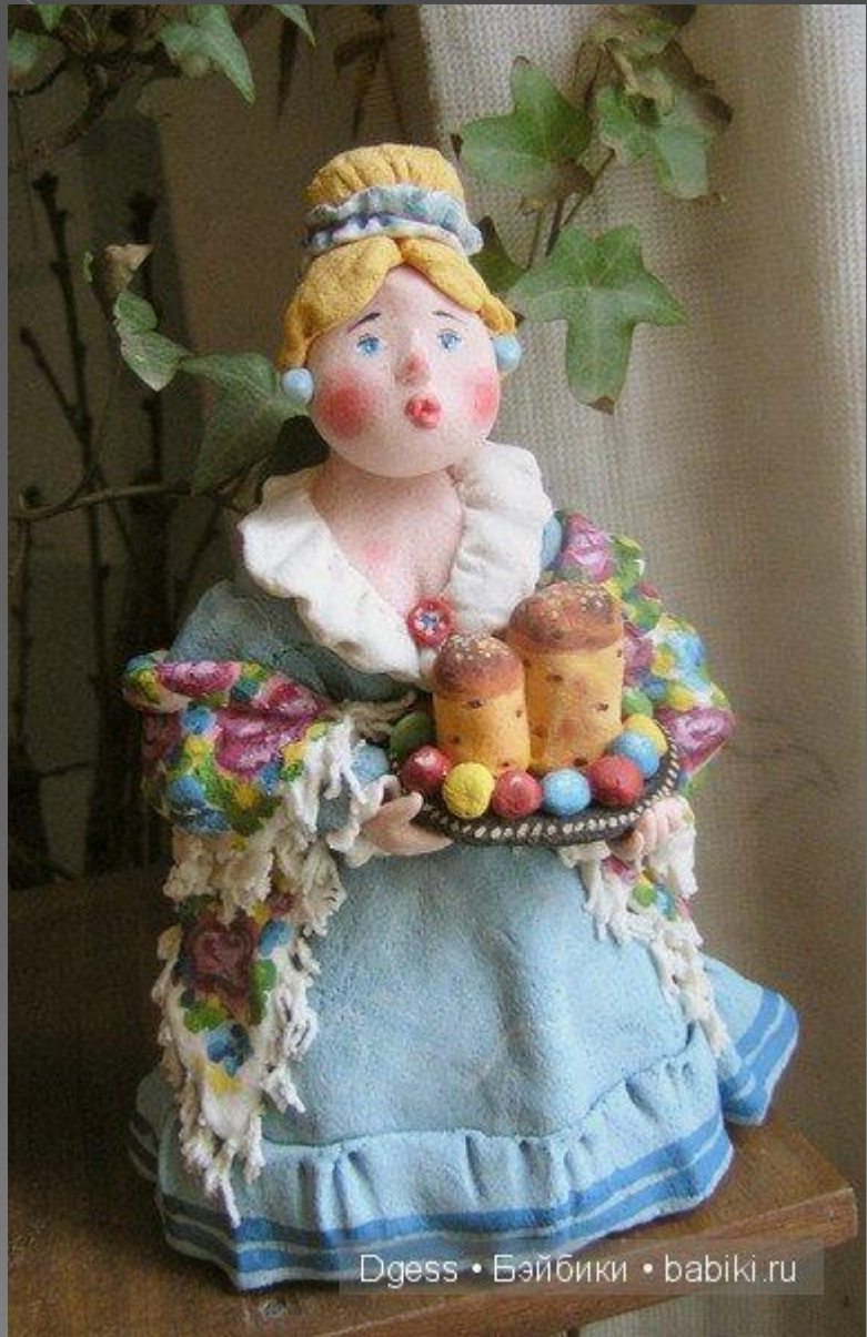
Dgess • Бэйбики • babiki.ru