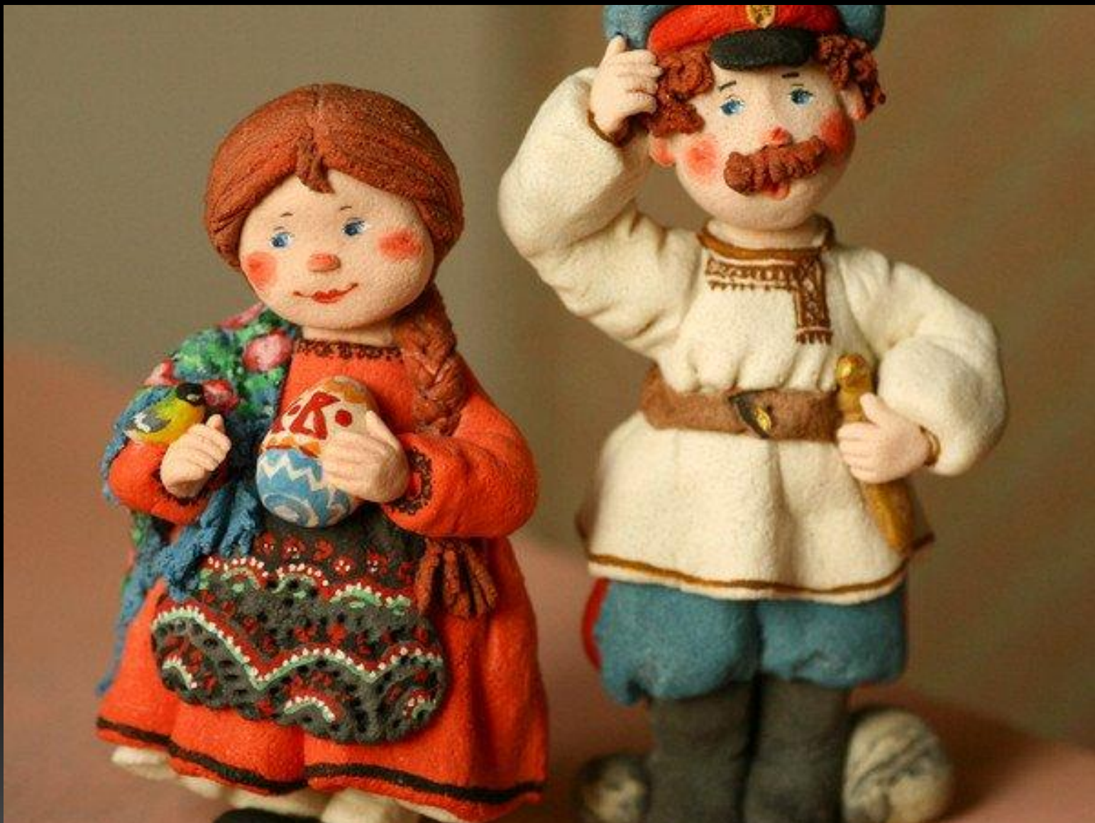
Авторские куклы Валентины Петруниной .