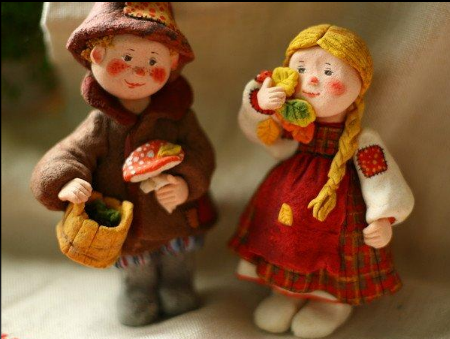
Авторские куклы Валентины Петруниной .