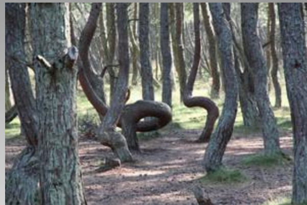
Лес Куршской косы