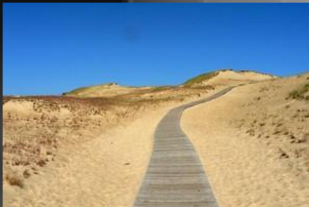
Дюна Куршской косы