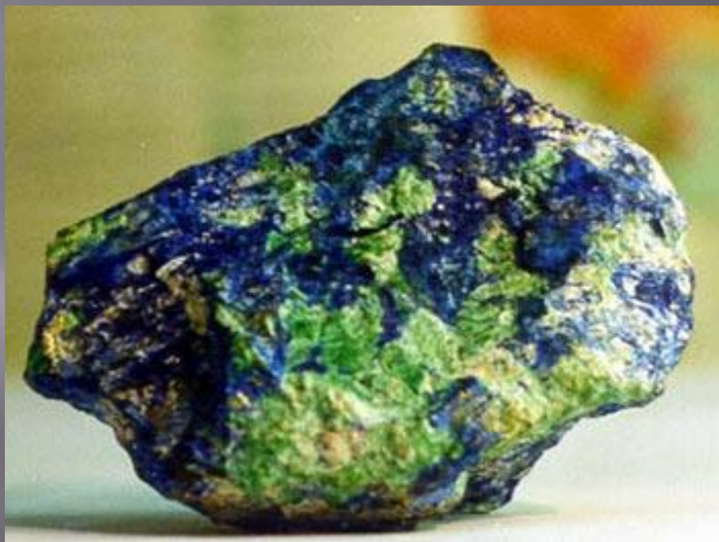
Малахит, азурит – медная руда

Наш край очень богат полезными ископаемыми. Это медь, свинец, цинк, серебро, золото и многое другое.