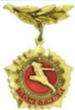
ПОЧЕТНЫЙ ЗНАК ГТО

«Почетный знак ГТО» вручался тем, кто выполнял нормативы в течение нескольких лет подряд.