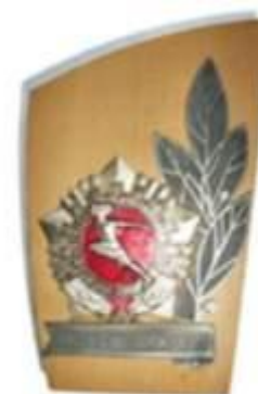
ЗНАК «ЗА УСПЕХИ В РАБОТЕ ПО КОМПЛЕКСУ ГТО»

Коллективы физкультуры предприятий, учреждений, организаций, добившиеся особых успехов по внедрению комплекса ГТО в повседневную жизнь трудящихся, награждались знаком «За успехи в работе по комплексу ГТО».