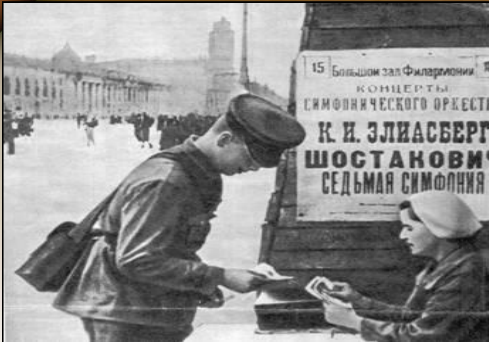
Билеты на седьмую симфонию Шостаковича, 1942