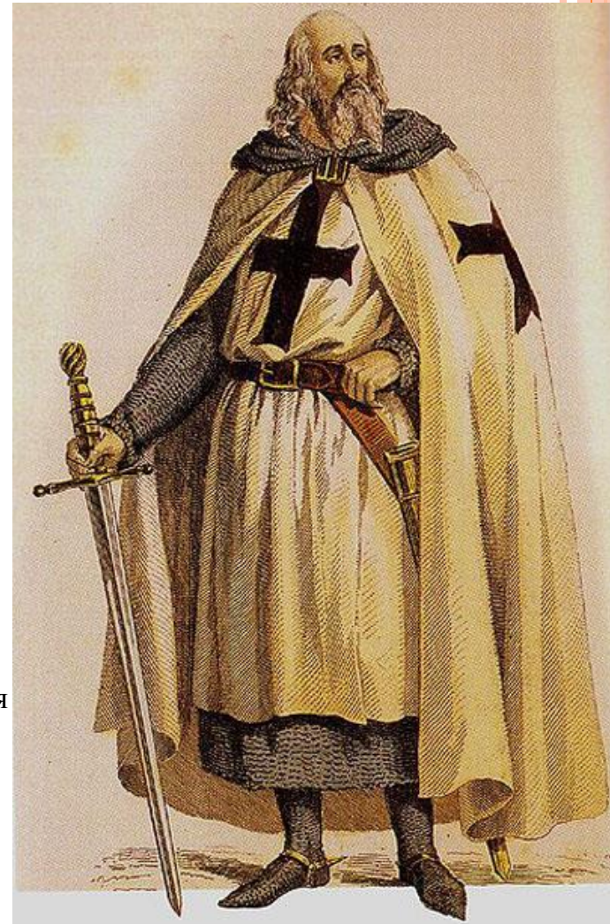
Жак де Моле (фр. Jacques de Molay; 1244-5/1249-50 — 18 марта 1314) — 23-й последний великий магистр ордена тамплиеров.