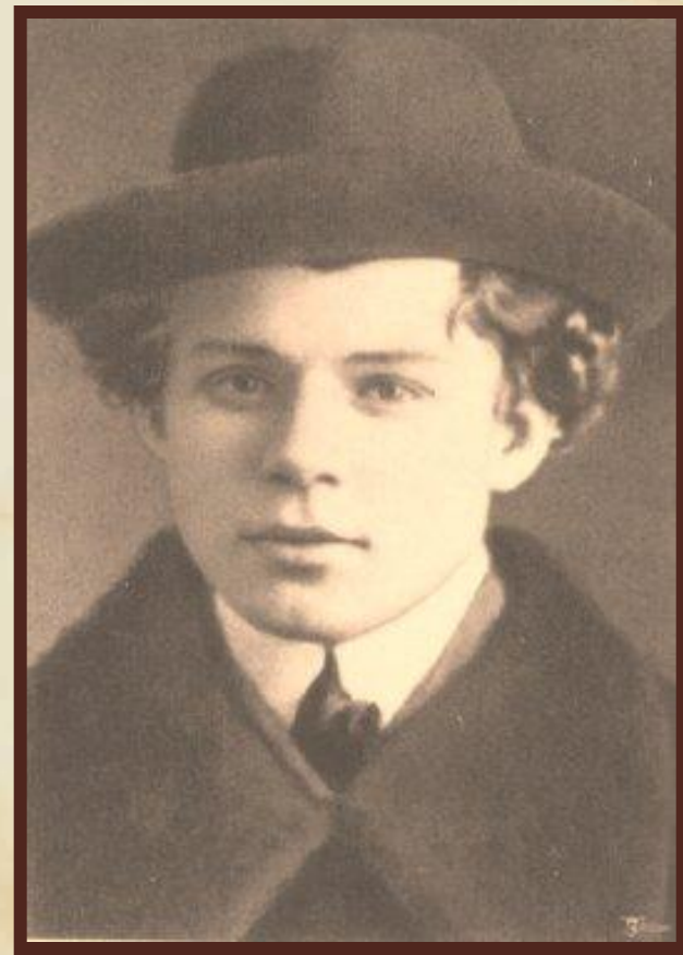
С.Есенин в 1919 году.

Сергей Александрович Есенин (род. 21 сентября(3 октября) 1895 г., село Константиново, Рязанская губерния – 28 декабря 1925 г., Ленинград) – русский поэт, представитель новокрестьянской поэзии(1914-1918 гг.), а позже и имажинизма(1918-1922 гг.)