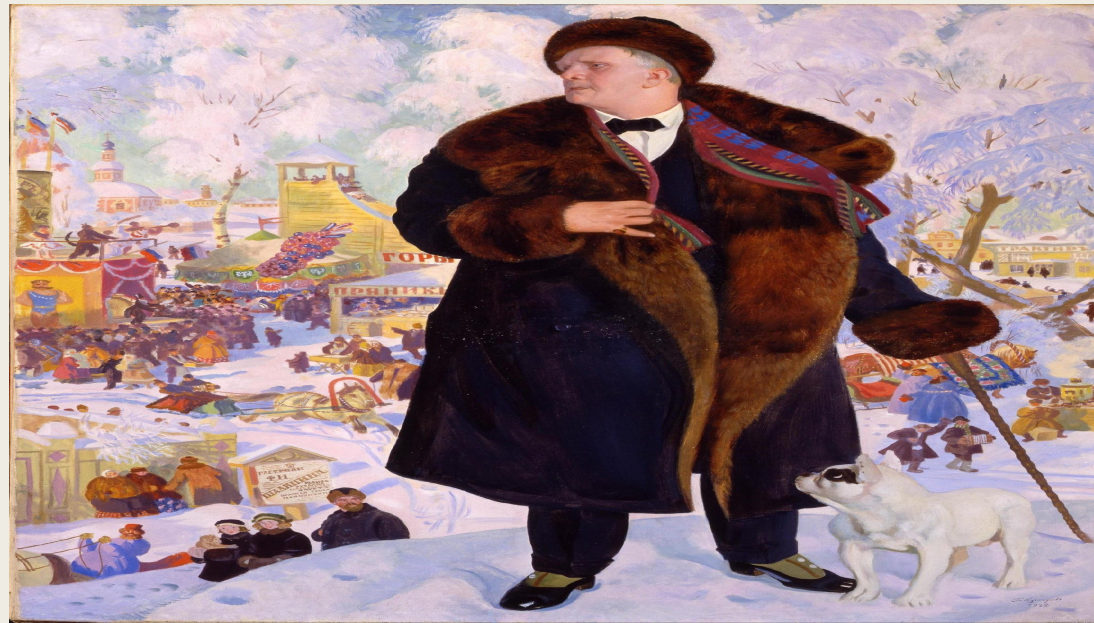
Борис Кустодиев. Портрет Фёдора Шаляпина, 1922

Логичным было появление и объединения, являющегося порождением эпохи. В 1922 году была образована АХРР – Ассоциация художников революционной России. Назначение своё они видели, согласно декларации, в живописном документировании процесса становления и формирования Советской России в реалистическом ключе. Ассоциация отвергала авангардные и иные изыскания. В Ассоциацию входили П.А. Радимов (1887 – 1967), Е.А. Кацман (1890 – 1976), Г.К. Савицкий (1887 – 1949), Е.М. Чепцов (1874 – 1950), И.И. Бродский (1884 – 1939), Ф.С. Богородский (1895 – 1959), А.М. Герасимов (1881 – 1963) и другие.