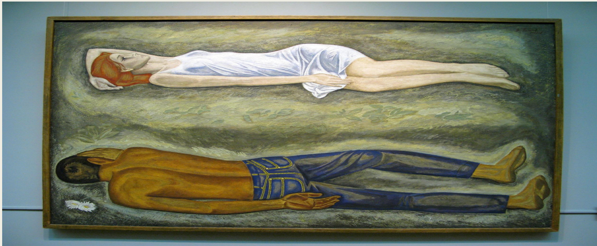
Попкова В. Е. « Двое »

Примечательно творчество В.Е. Попкова (1932 – 1974), который отличался не только особым, гражданственным настроем своих картин, но и постоянными творческими поисками («Двое», «Ой, как всех мужей побрали на войну», «Мой день»).