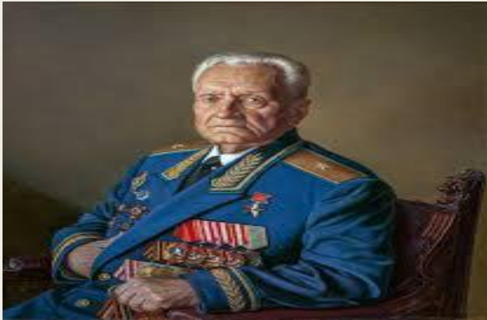
Художник Александр Шилов

Таким образом, можно сказать, что русская живопись XX века совершила своеобразный круговорот: от разнообразия стилей, имён, жанров и противоречий она прошла сквозь официоз советского периода для того, чтобы в конце XX – начале XXI века вернуться к спорам, противоречиям и поискам.