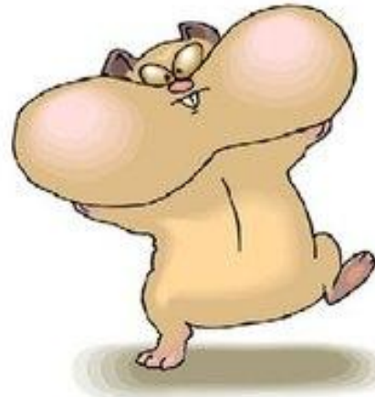
ланіты — щёки

— устаревшие слова, не выдержавшие конкуренции с другими словами и выражениями, вышедшее из активного употребления, перешедшее в пассивный словарный запас.