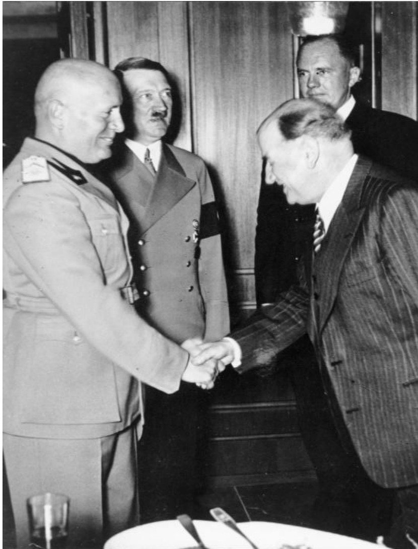
20. September 1938