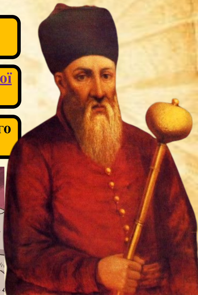
Петро Сагайдачний гетьман реєстрового козацтва 1614 – 1622 з перервами