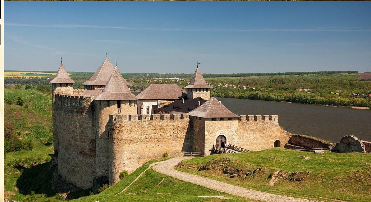
Хотинська фортеця. XIII-XVI ст.