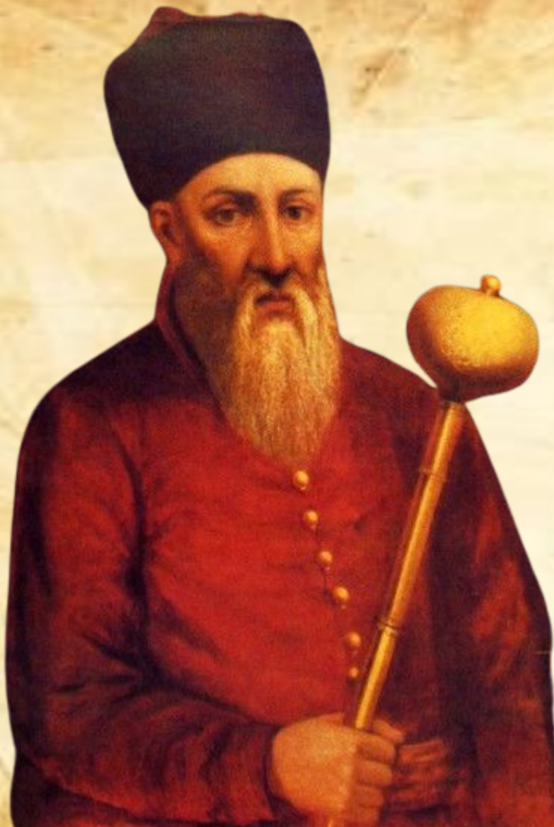
Петро Конашевич-Сагайдачний гетьман реєстрового козацтва 1614 – 1622 рр. з перервами

✓ Вдавався до переговорів і компромісів з польською владою, збільшено реєстр