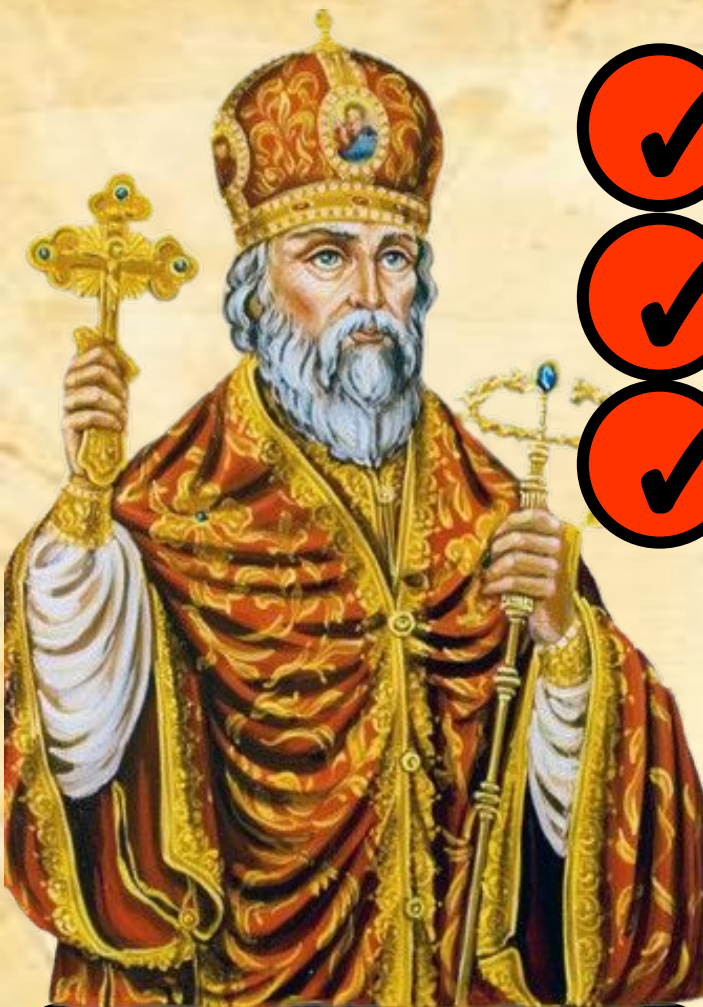
Йов Борецький 1620-1631 київський православний митрополит