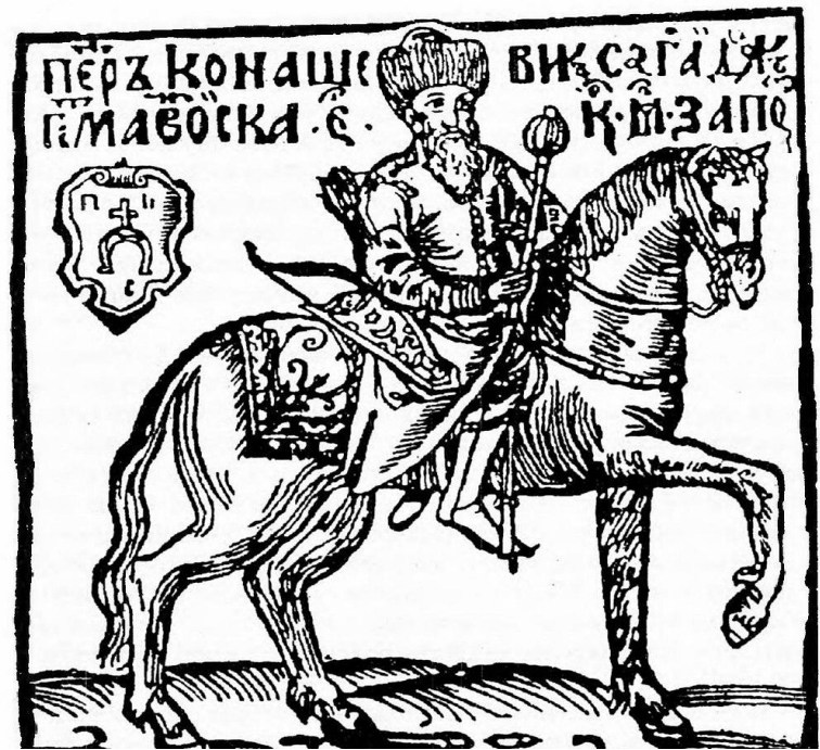
Портрет Петра Конашевича-Сагайдачного з книги «Вірші на жалісний погреб шляхетного рицаря Петра Конашевича-Сагайдачного»