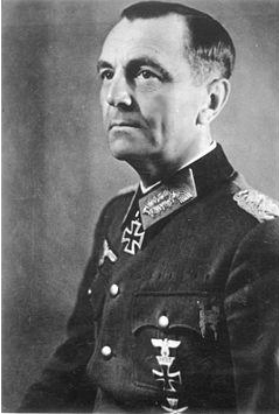
Командующий 6-й германской армией генерал Паулюс