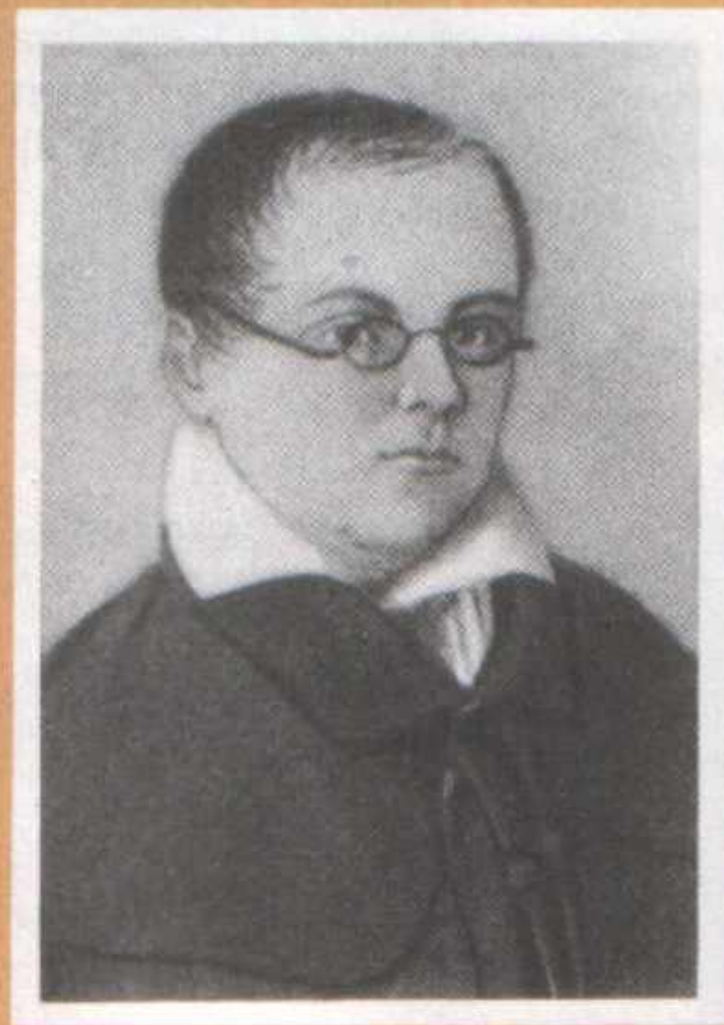
А. А. ДЕЛЬВИГ

Когда постиг меня судьбины гнев, Для всех чужой, как сирота бездомный, Под бурею главой поник я томной И ждал тебя, вещун пермесских дев, И ты пришел, сын лени вдохновенный, О Дельви́г мой: твой голос пробудил Сердечный жар, так долго усыпленный, И бодро я судьбу благославил.