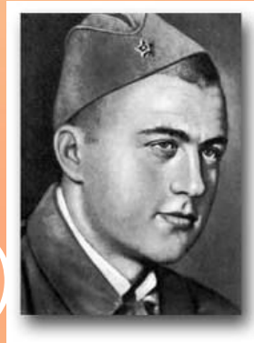
Михаил Кульчицкий (1919-1943)