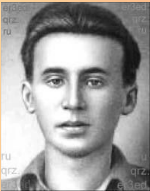
Павел Коган (1919-1942)