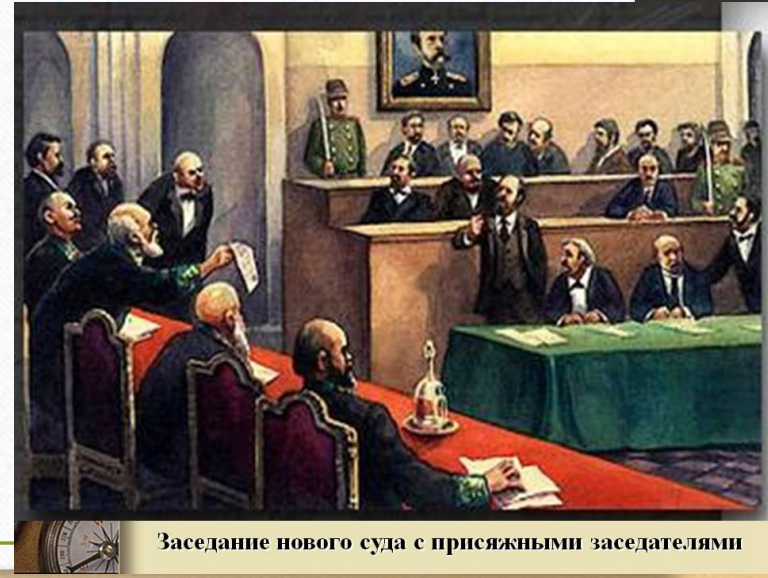
Заседание нового суда с присяжными заседателями