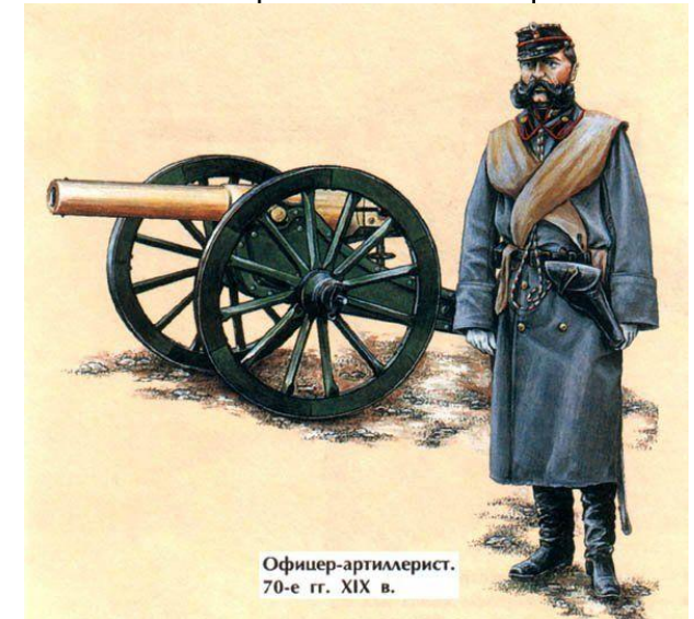
Офицер-артиллерист. 70-е гг. XIX в.