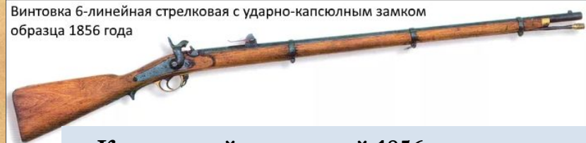
Капсульной винтовкой 1856 г. выпуска

Винтовка 6-линейная стрелковая с ударно-капсульным замком образца 1856 года