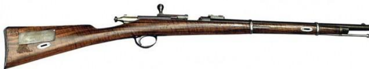
В 1868 году принимается винтовка Бердана

10,67-мм винтовка системы Бердана обр. 1868 г. с трехгранным штыком. На стволе надпись: «Калтовский Оружейный завод, г. Гартфорд, Америка, №3». Изм. №5/129