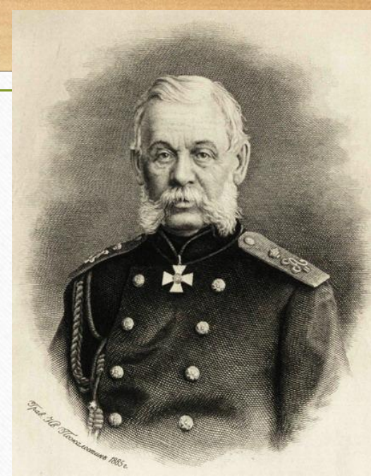
Дмитрий Алексеевич Милютин. И. П. Пожалостин. Гравюра