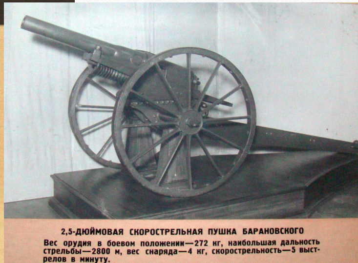
2,5-дюймовая скорострельная пушка Барановского Вес орудия в боевом положении—272 кг, наибольшая дальность стрельбы—2800 м, вес снаряда—4 кг, скорострельность—3 выстрелов в минуту.