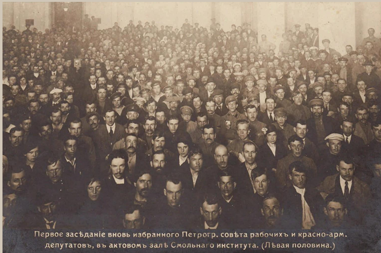
Первое заседание вновь избранного Петрогр. совета рабочих и красно-арм. депутатов, в актовом зале Смольного института. (Левая половина.)

В ходе революционных событий в Петрограде одновременно возникли два органа власти: Временное правительство, опиравшееся на поддержку буржуазии, дворянства, офицерства. Петроградский Совет, опиравшийся на рабочих и солдат столичного гарнизона. Наличие двух органов власти было названо В.И. Лениным двоевластием.