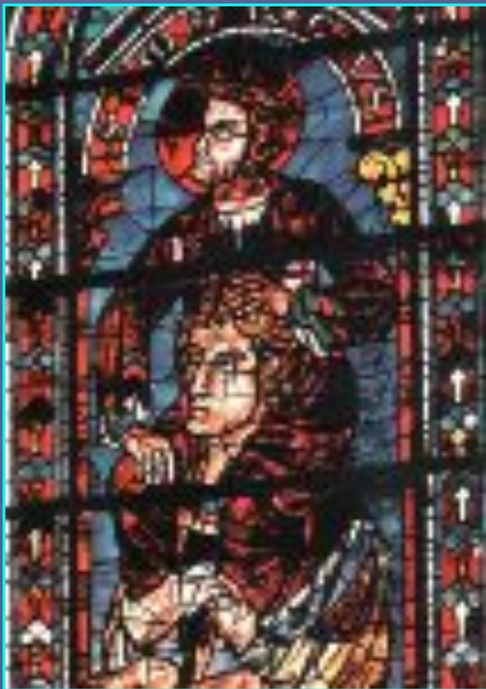
Южная роза Шартрского собора

Считается, что окна-розы Шартрского собора — самые старые во Франции.