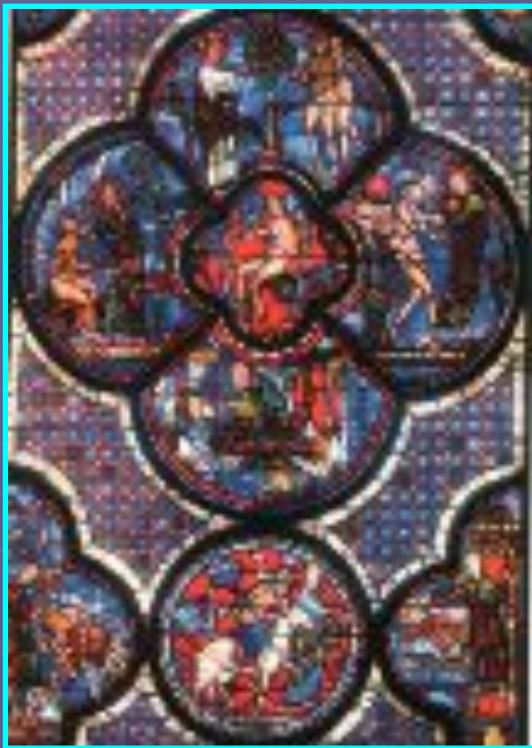
Центральное окно западной стены Шартрского собора