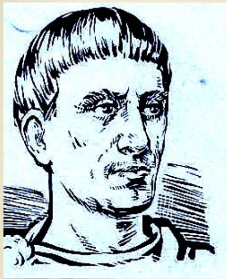
Диофант Александрийский (III век н. э.) — древнегреческий математик.

Еще в глубокой древности было замечено, что некоторые многочлены можно умножать быстрее, чем все остальные. Так, древнегреческими математиками еще до нашей эры (более 2000 лет назад) геометрическим способом были выведены некоторые формулы, которые получили название формулы сокращенного умножения.