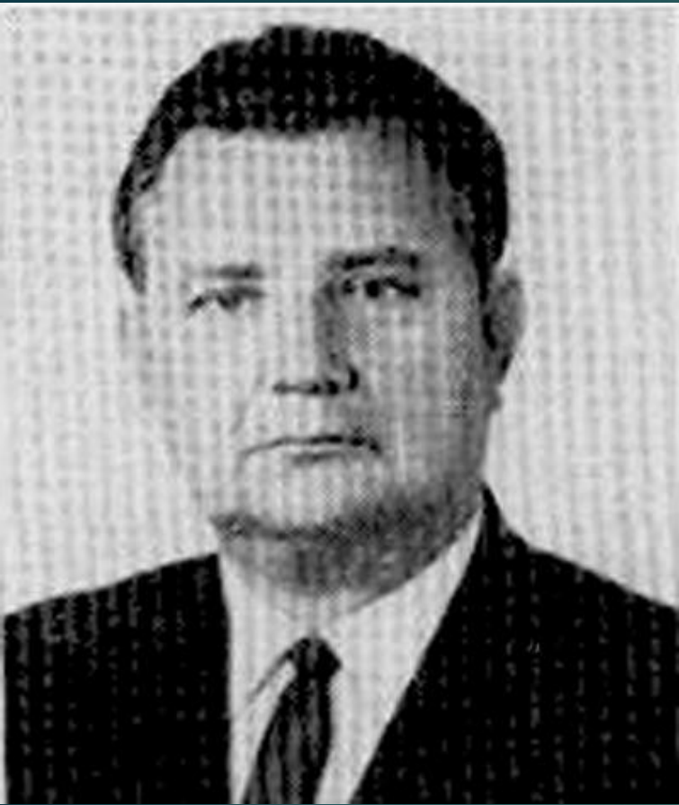
Криулин Глеб Александрович (1923–1988)

Советский государственный и партийный деятель, дипломат. Первый секретарь Могилёвского обкома Компартии Беларуси (1964–1974), Чрезвычайный и Полномочный Посол СССР.