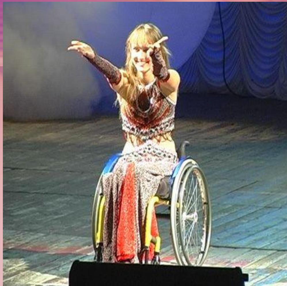
Танцевальный конкурс среди девушек-инвалидов