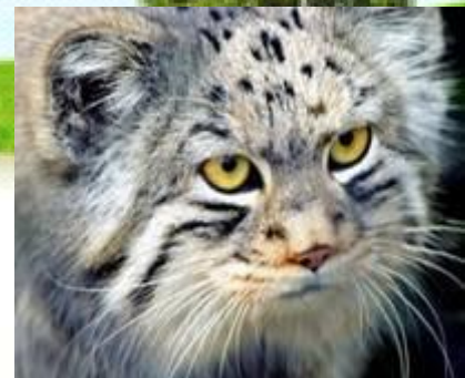
ДИКИЙ КОТ МАНУЛ