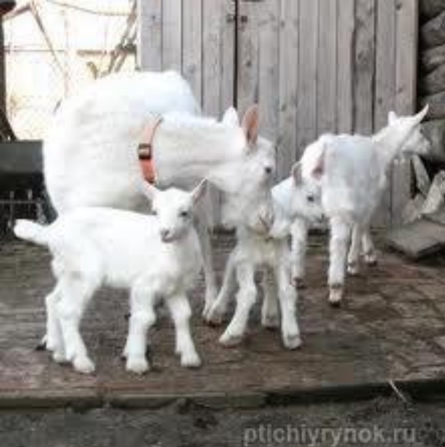
Коза с КОЗЛЯТАМИ