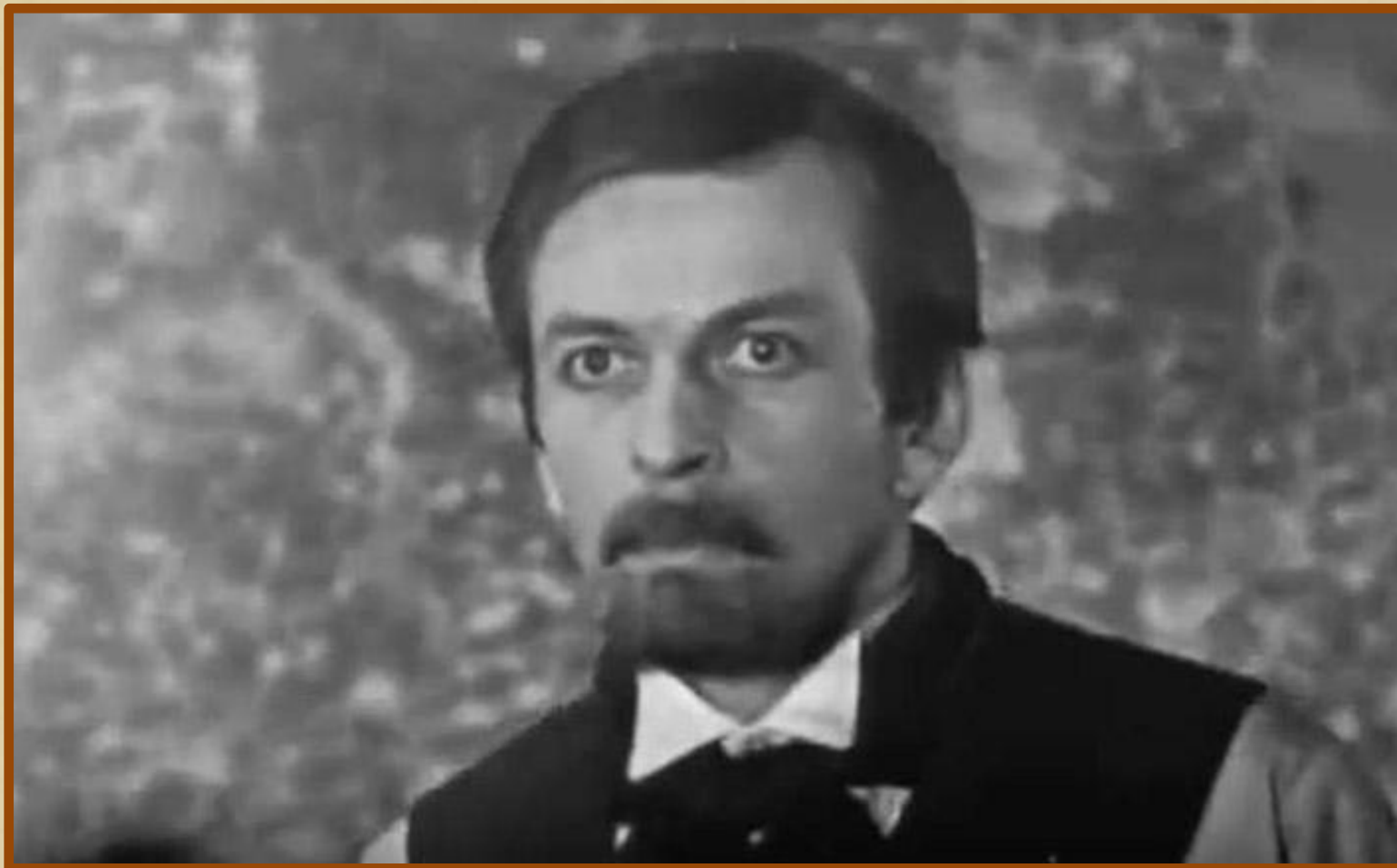
Александр Кирсанов (Кадр из фильма «Что делать?», 1971 г.)