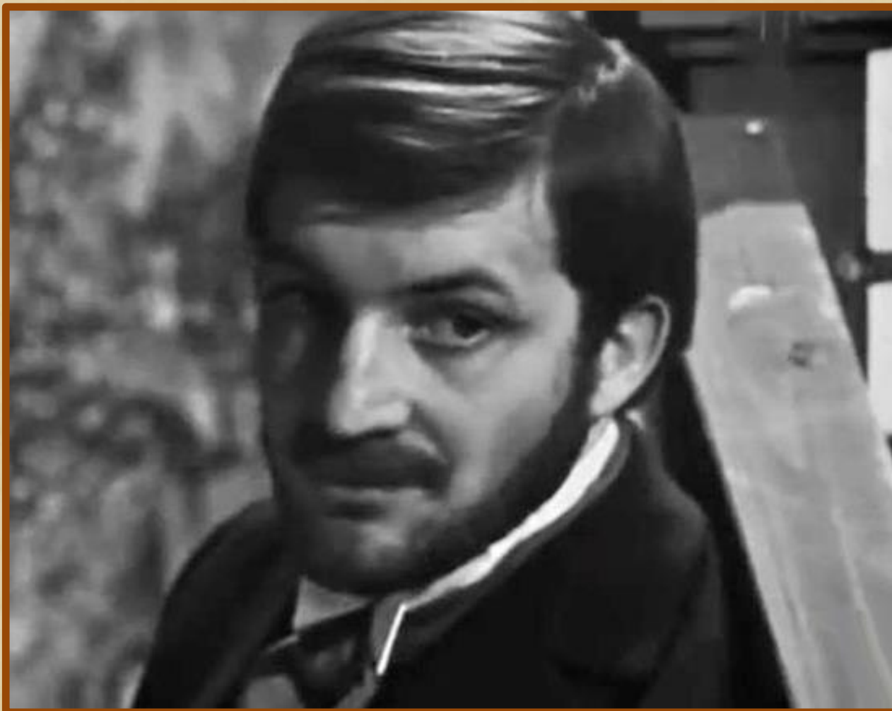
Рахметов (Кадр из фильма «Что делать?», 1971 г.)