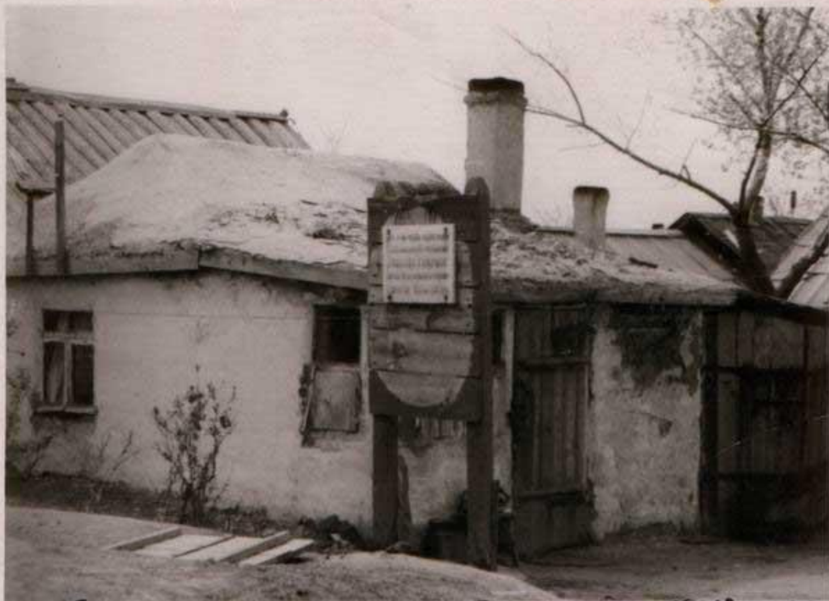
Дом где жил Сергей Тюленин до 1943 года.