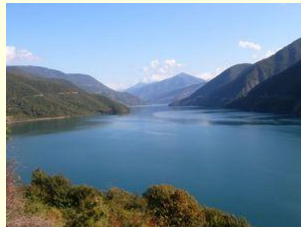
Жинвальское водохранилище Жинвальское водохранилище на Арагви