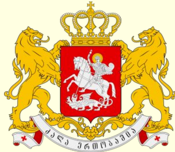
ძალა ერთობაშია Под щитом находится лента с девизом «Сила в единстве».