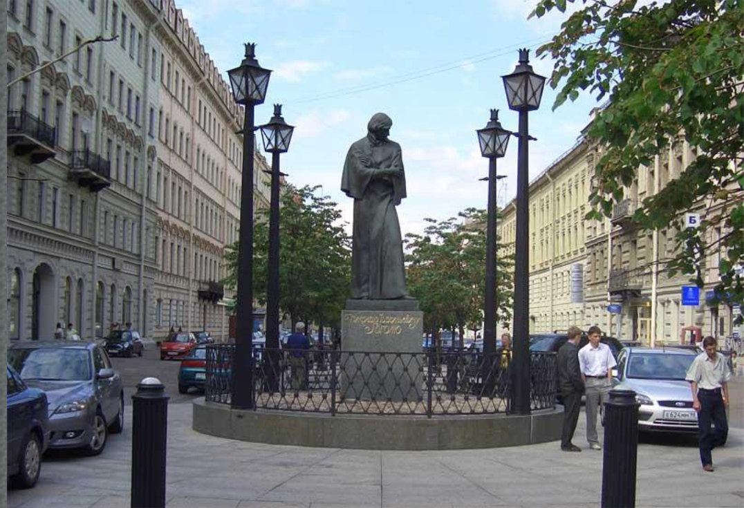
Памятник Н.В.Гоголю на Конюшенной