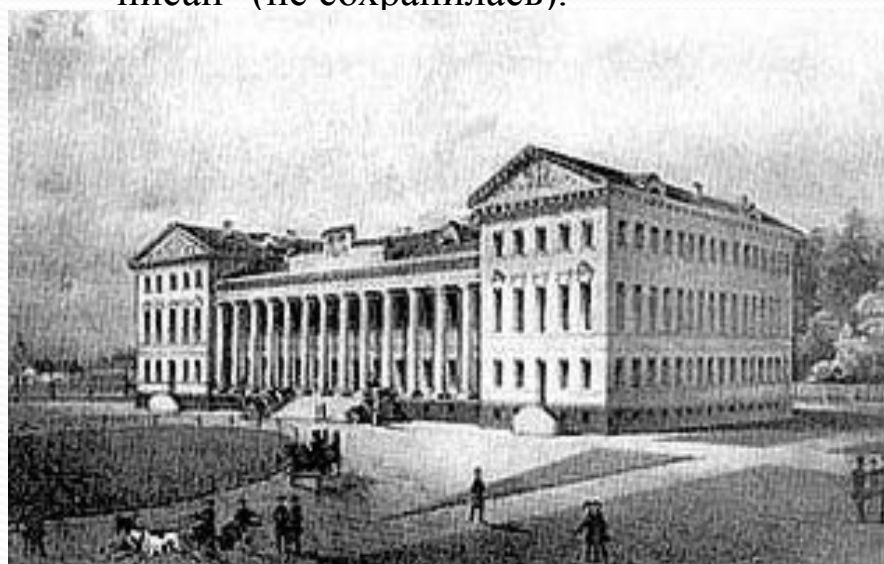
Нежинская гимназия высших наук