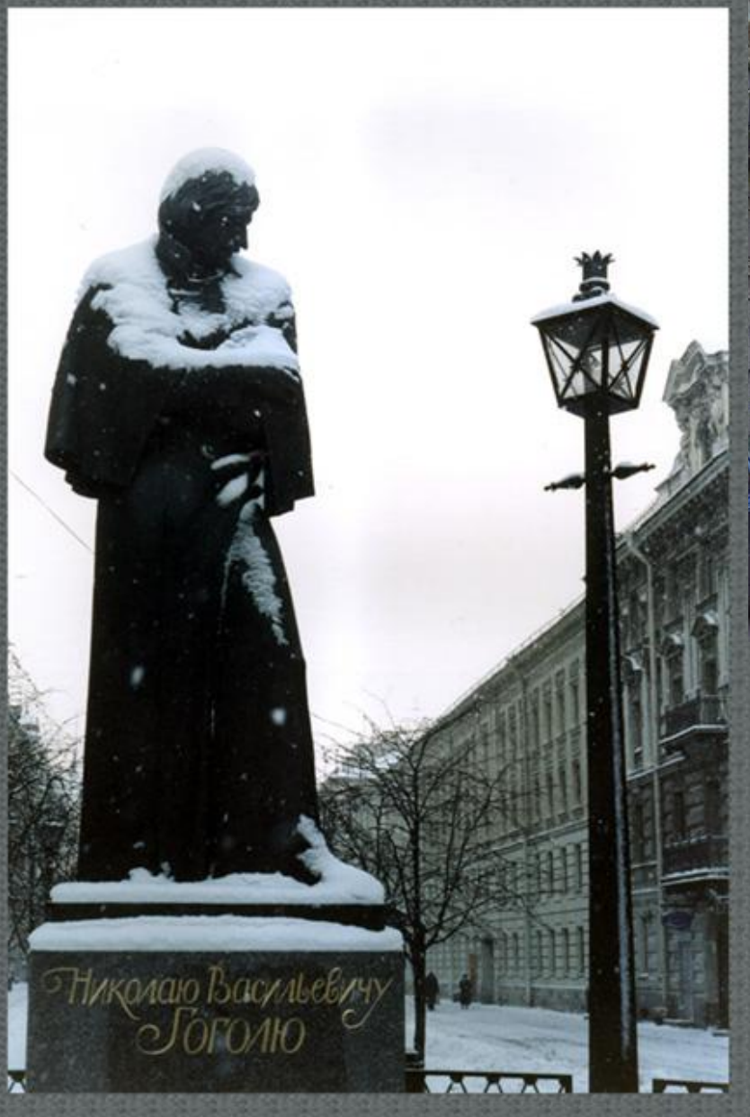
Памятник Н. В. Гоголю