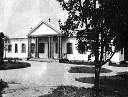
Дом в Васильевке.

В 1818-19 Гоголь вместе с братом Иваном обучался в Полтавском уездном училище, а затем, в 1820-1821, брал уроки у полтавского учителя Гавриила Сорочинского, проживая у него на квартире. В мае 1821 поступил в гимназию высших наук в Нежине. Здесь он занимается живописью, участвует в спектаклях — как художник-декоратор и как актер, причем с особым успехом исполняет комические роли. Пробует себя и в различных литературных жанрах (пишет элегические стихотворения, трагедии, историческую поэму, повесть). Тогда же пишет сатиру "Нечто о Нежине, или Дуракам закон не писан" (не сохранилась).