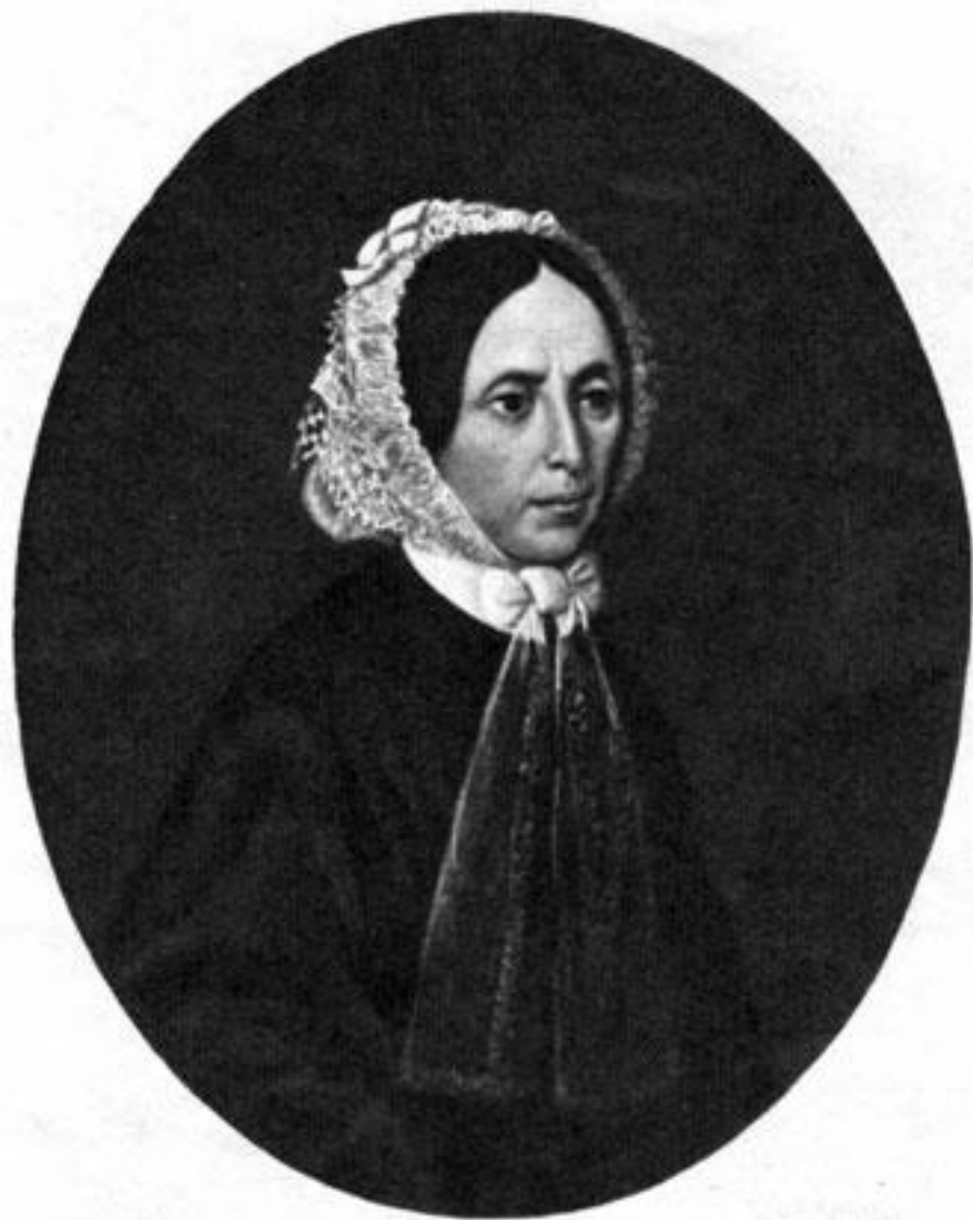
МАТЬ ПИСАТЕЛЯ, М. И. ГОГОЛЬ-ЯНОВСКАЯ, УРОЖД. КОСЯРОВСКАЯ. Работа неизвестного художника.