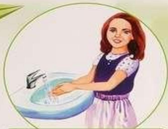
Умываюсь холодной водой