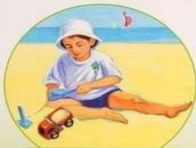
Греюсь на солнышке