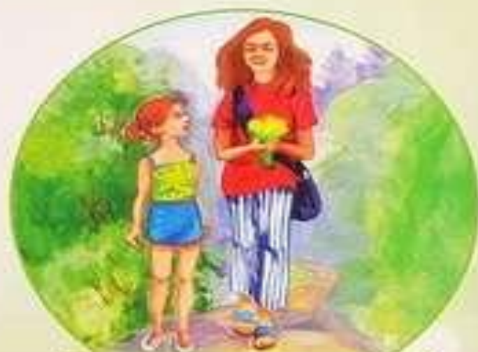
Гуляю на улице