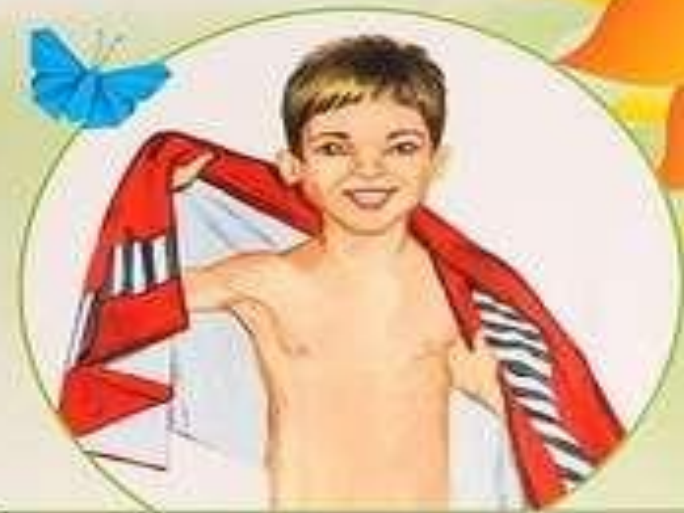
Обтираюсь влажным полотенцем