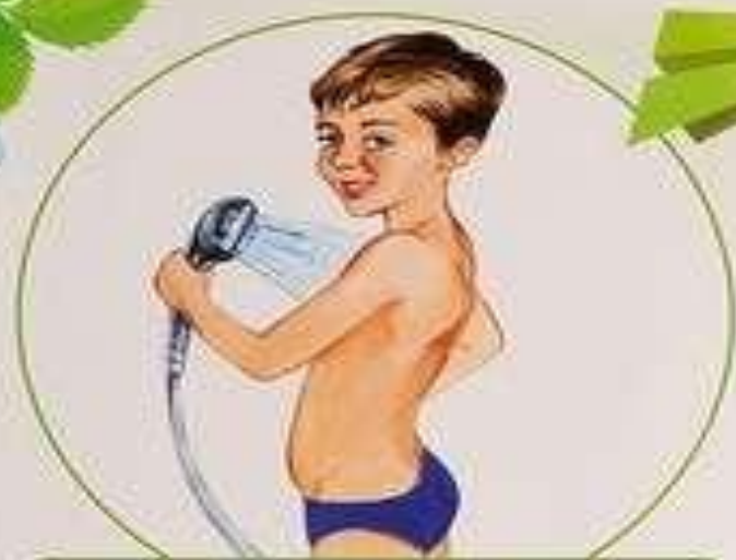
Принимаю контрастный душ

Закаливание дарит нам здоровье и отличное настроение