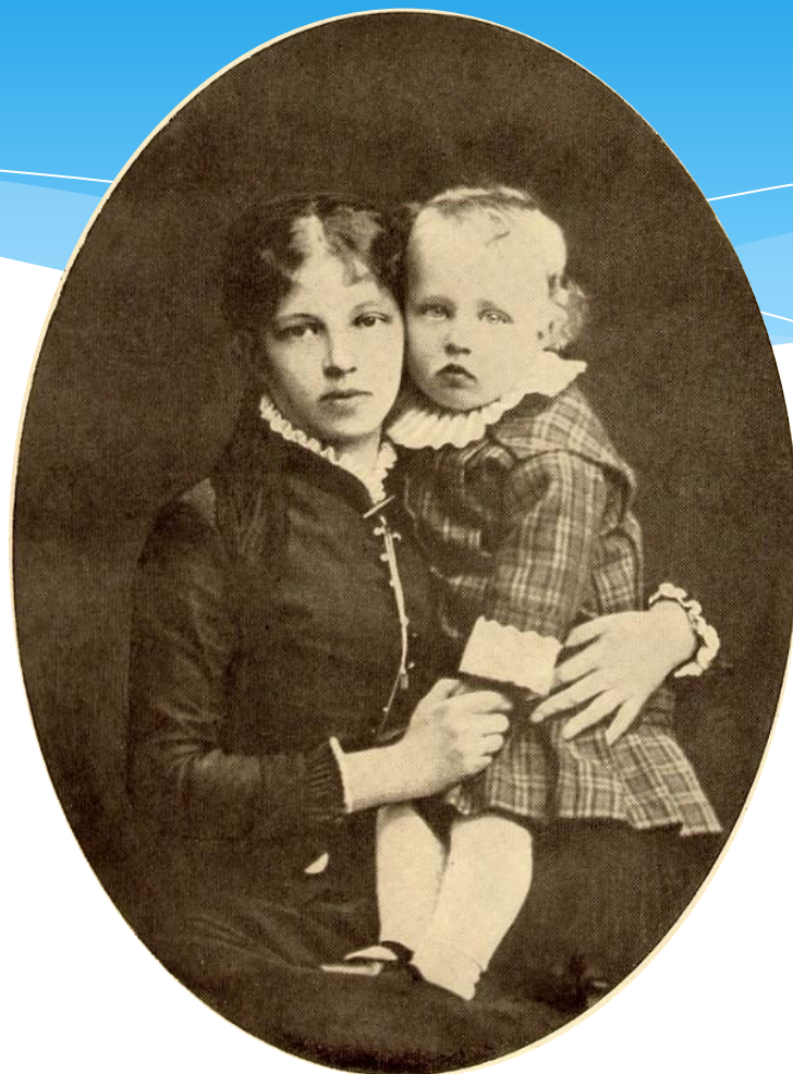
Блок с матерью