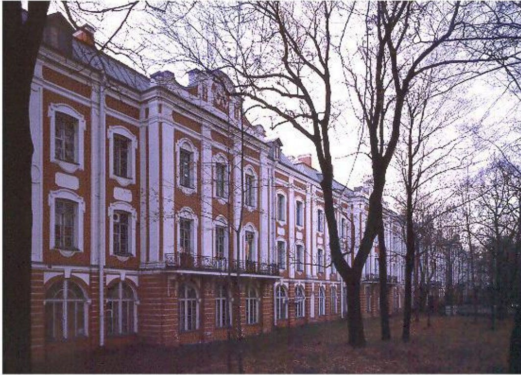
«Ректорский флигель», ныне Университетская наб.7