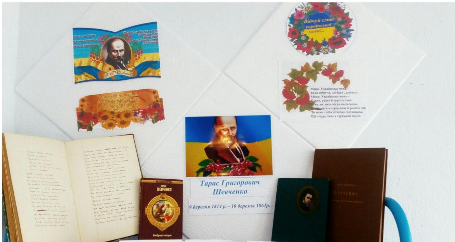
Куток у шкільній бібліотеці, присвячений Тарасу Григоровичу Шевченку