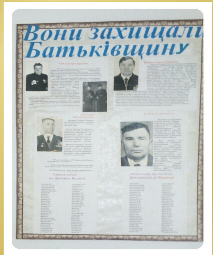
Фото односельчан, які воювали у роки Великої Вітчизняної війни та в Афганістані. Фото ветеранів та історії їхнього життя.