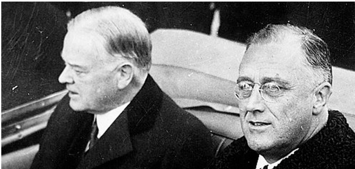
Герберт Гувер и Франклин