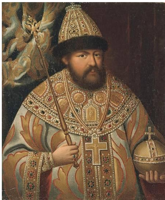
Алексей Михайлович, русский царь, отец Петра

Петр был младшим сыном царя Алексея Михайловича. Царь Алексей был женат два раза. От первого брака у него было 13 детей. Многие из них умерли ещё при жизни отца, и из сыновей только Федор и Иван его пережили, хотя и были оба серьезно болезненными. Царь был очень рад рождению сына.