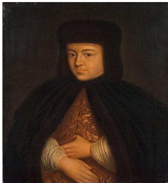
Наталья Кирилловна Нарышкина, мать Петра