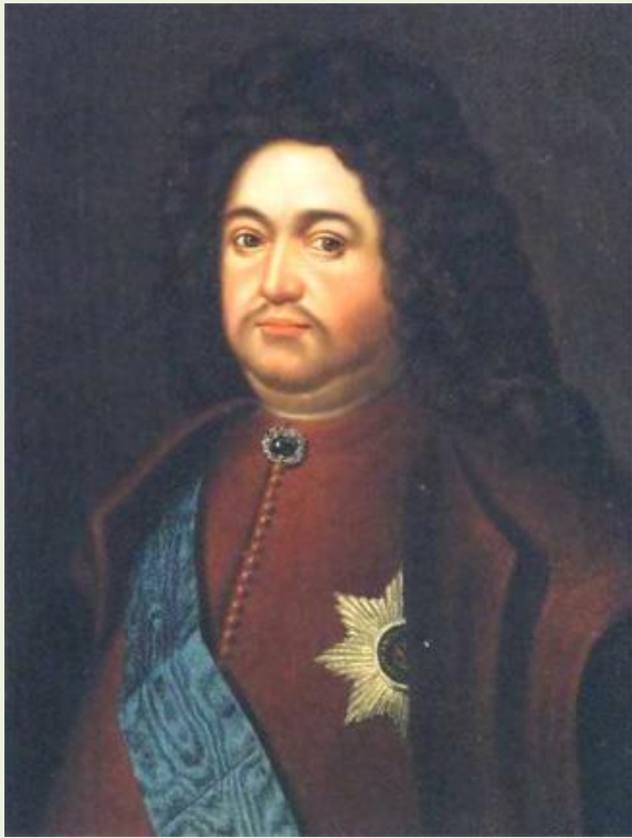
Головин Ф. А.

Руководителями посольства были назначены генерал-адмирал Ф. Я. Лефорт , руководитель Посольского приказа генерал Ф. А. Головин и думный дьяк П. Б. Возницын .