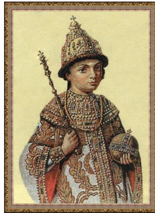
Петр I Алексеевич