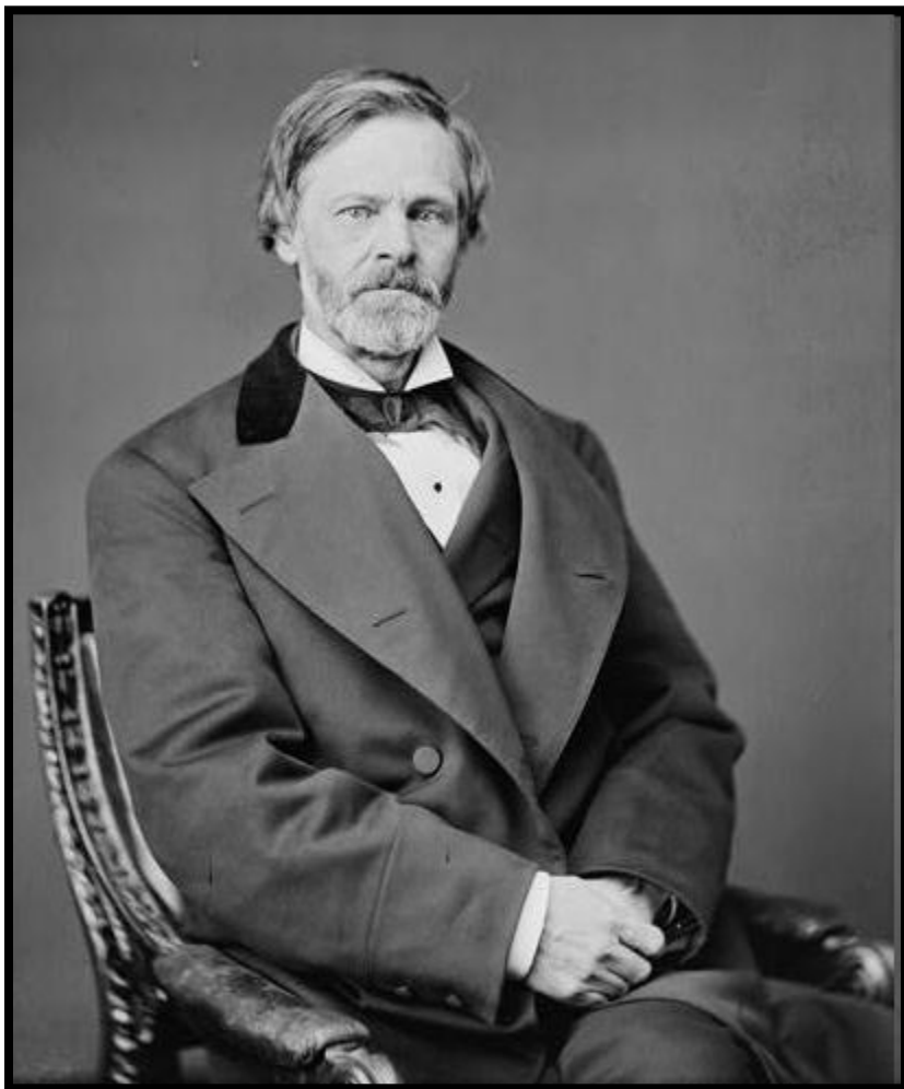
Сенатор Джон Шерман

1890 год - первый антитрестовский (антимонопольный) закон США, провозгласивший преступлением препятствование свободе торговли созданием треста (монополии) и вступление в сговор с такой целью. Акт Шермана обязывал федеральных прокуроров преследовать такие преступные объединения и устанавливал наказание в виде штрафов, конфискации и тюремных сроков до 10 лет. Назван по имени инициатора законопроекта — политика Джона Шермана