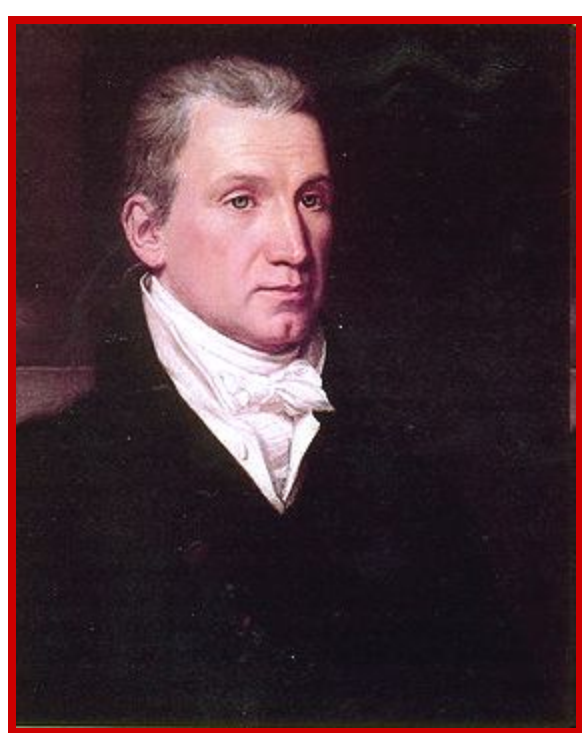
Джеймс Монро 1817-1825

Газеты кричали об особой миссии США, этой Богом избранной страны, которая должна спасти погрязший в грехах мир.