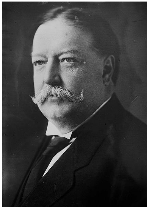
Уильям Говард Тафт – американский президент, 1909 - 1913