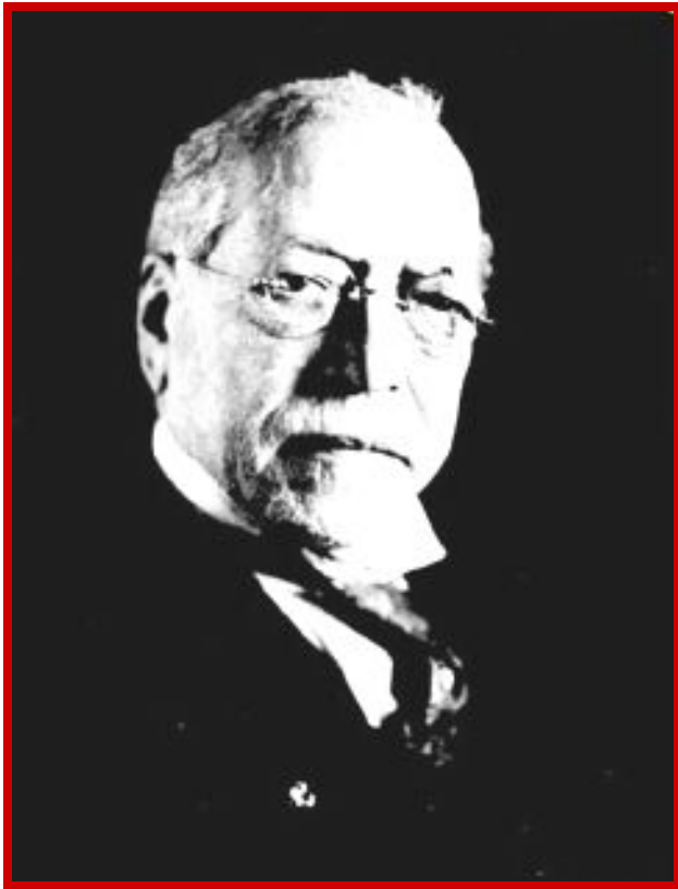
Руководитель АФТ Сэм Гомперс