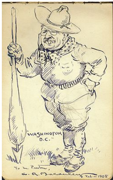
Карикатура на Т. Рузвельта