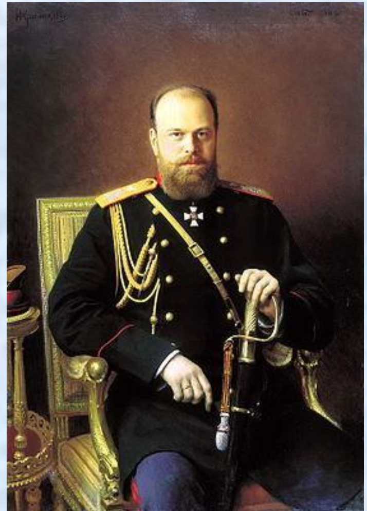
Император Александр III (1881 – 1894)