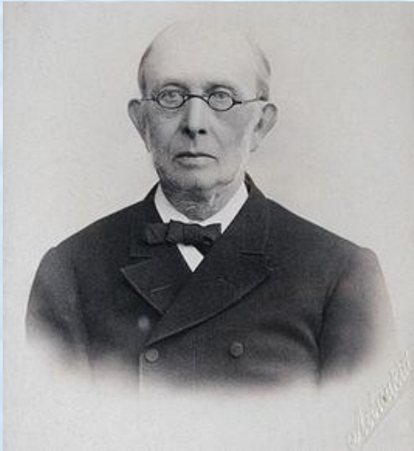
Константин Петрович Победоносцев, обер-прокурор Святейшего Синода в 1880 – 1905 гг.