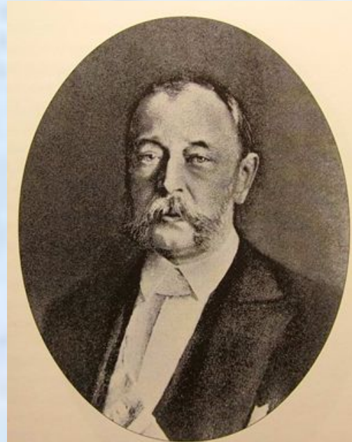
Дмитрий Андреевич Толстой, министр внутренних дел Российской империи в 1882 – 1889 гг.