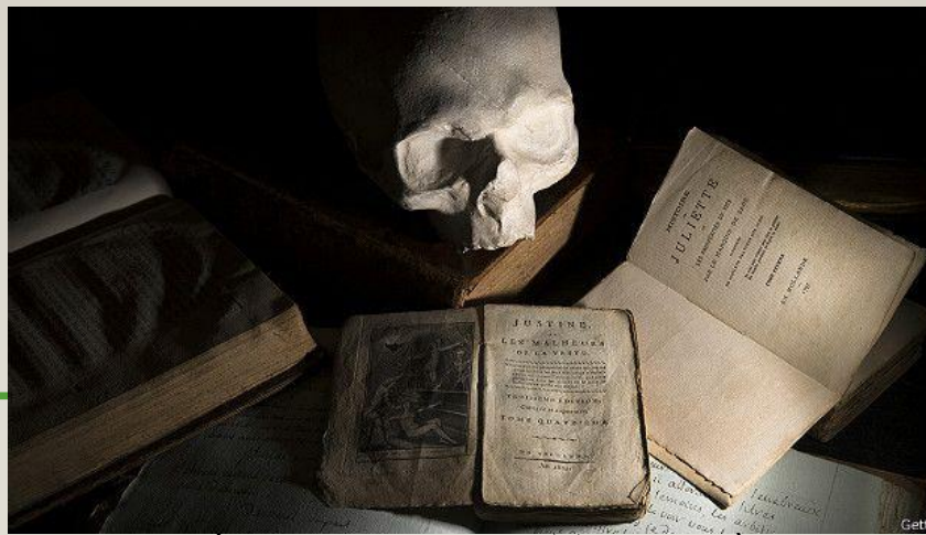
(слепок черепа Маркиза)