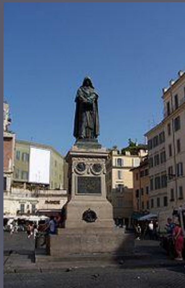
Памятник Джордано Бруно