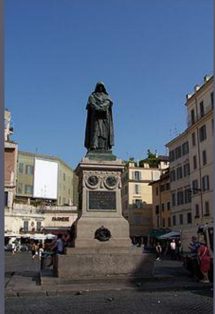
Памятник Джордано Бруно в Риме на Кампо деи Фиори, месте его казни