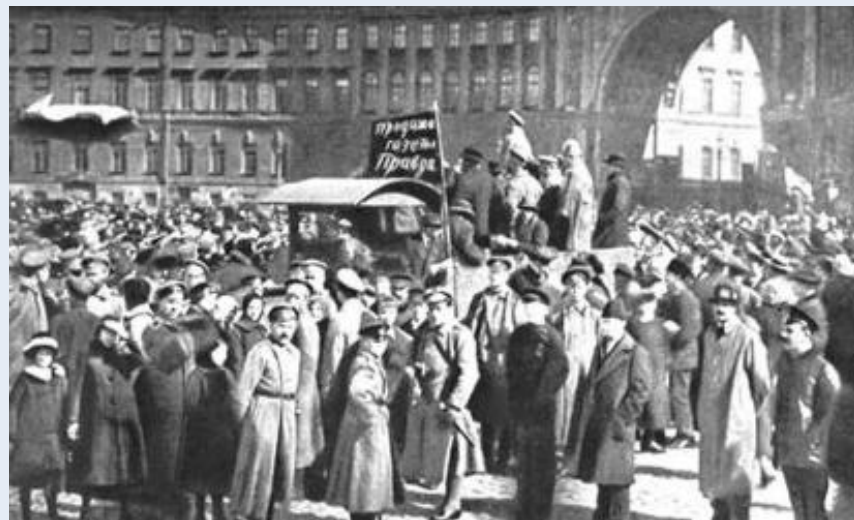
Демонстрация в поддержку большевиков