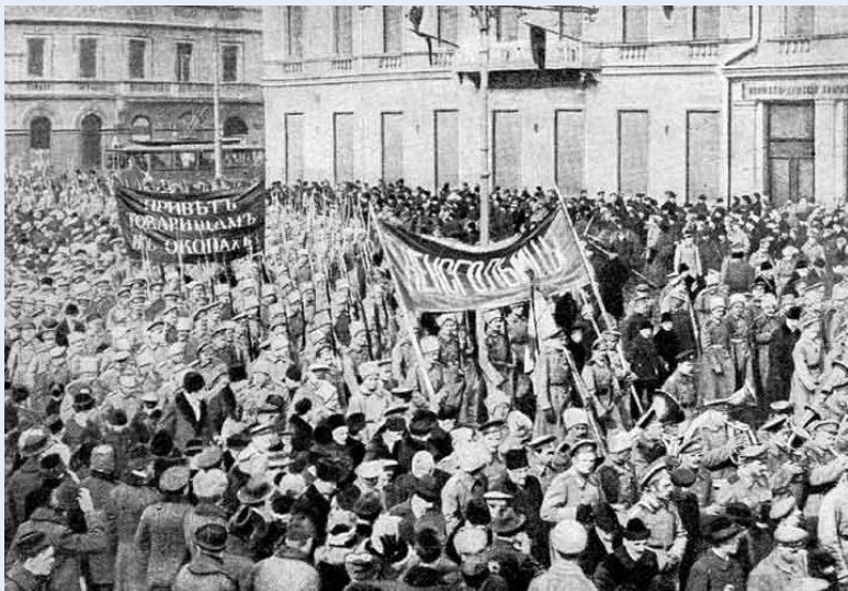
Солдатская демонстрация в Петрограде в февральские дни. 1917 г.