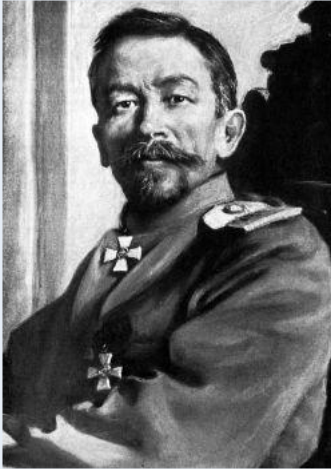
Лавр Георгиевич Корнилов