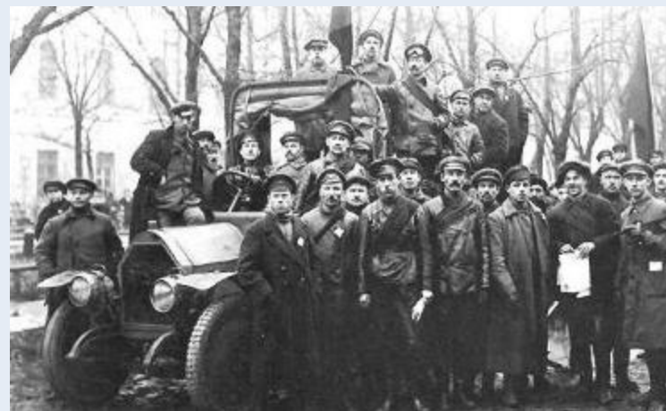
Красногвардейцы на улицах Петрограда