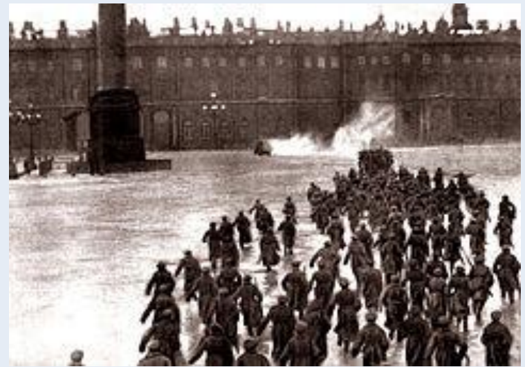
Штурм Зимнего дворца. Кадр из художественного фильма «Октябрь», 1927 г