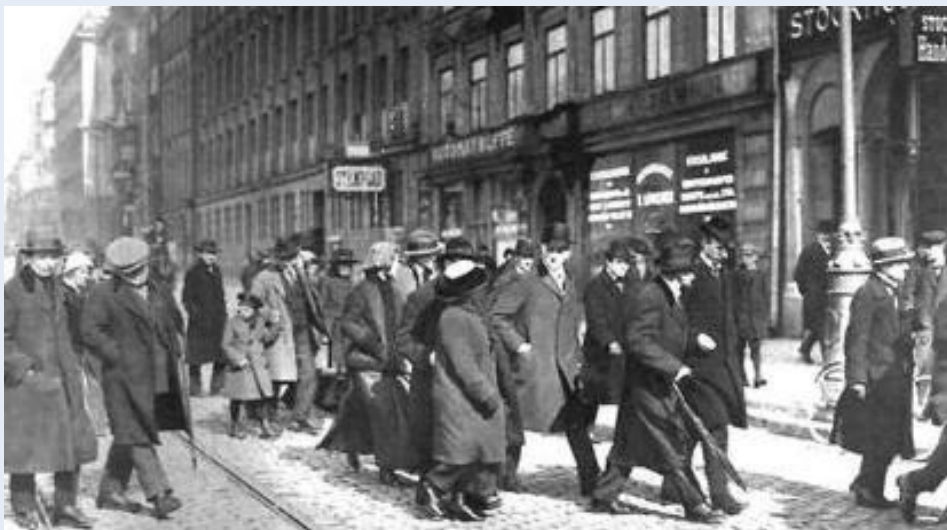
Ленин и его соратники на вокзале Стокгольма