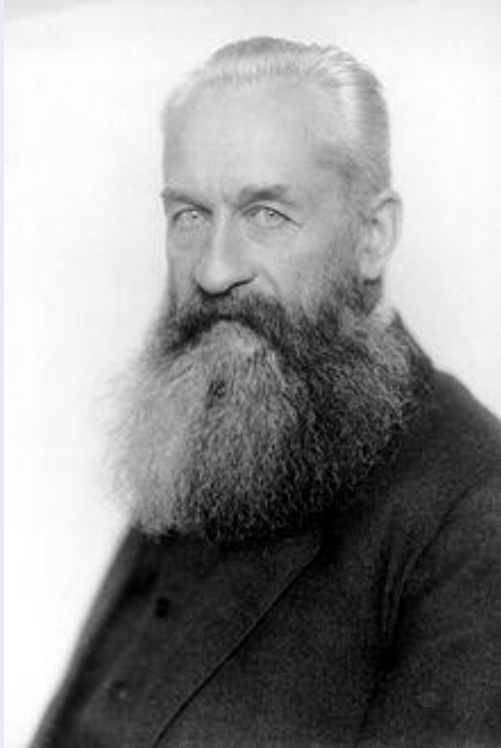
Первый глава Временного правительства, князь - Георгий Евгеньевич Львов