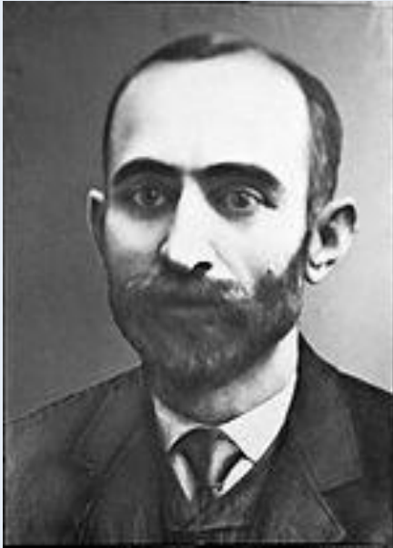
Николай Семенович Чхеидзе