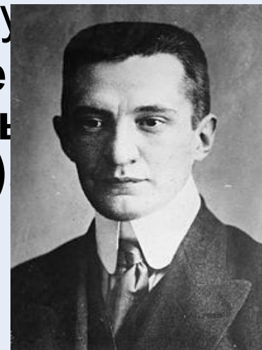
Александр Федорович Керенский