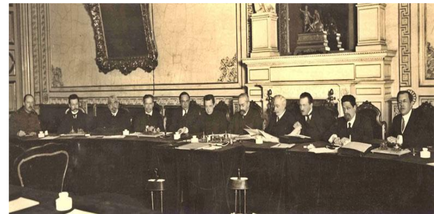
Заседание первого состава Временного правительства