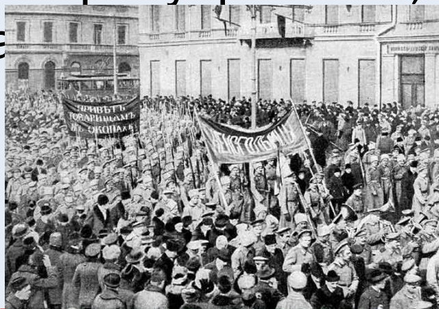
Демонстрация на Невском