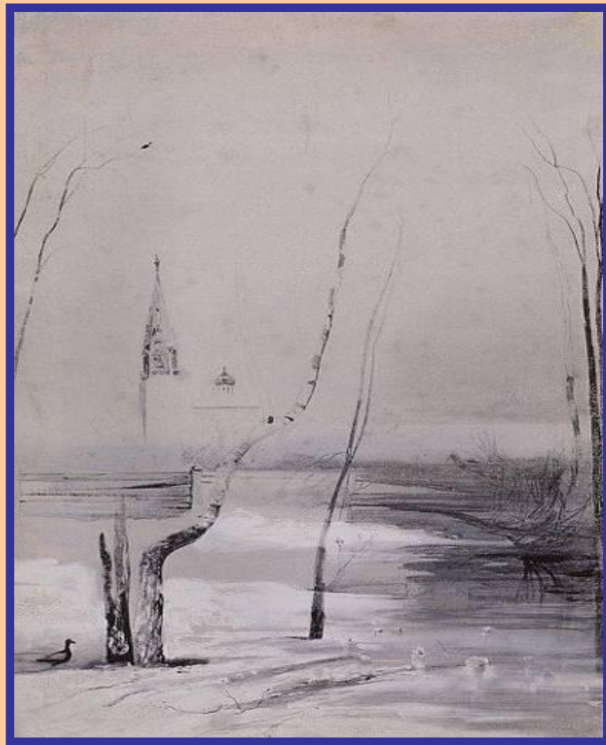
Набросок «Пейзаж с церковью и колокольней»

Картина создана в 1871 году. Первоначальные этюды к картине А.К.Саврасов писал в селе Молвитино, находившемся близ Костромы. Полотно показали на первой передвижной выставке, и оно было встречено с восторгом. Павел Третьяков сразу же приобрёл этот шедевр для своей галереи.