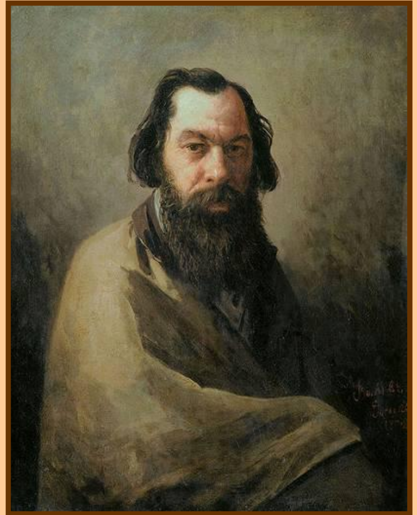
И.Волков Портрет художника А.К. Саврасова 1984