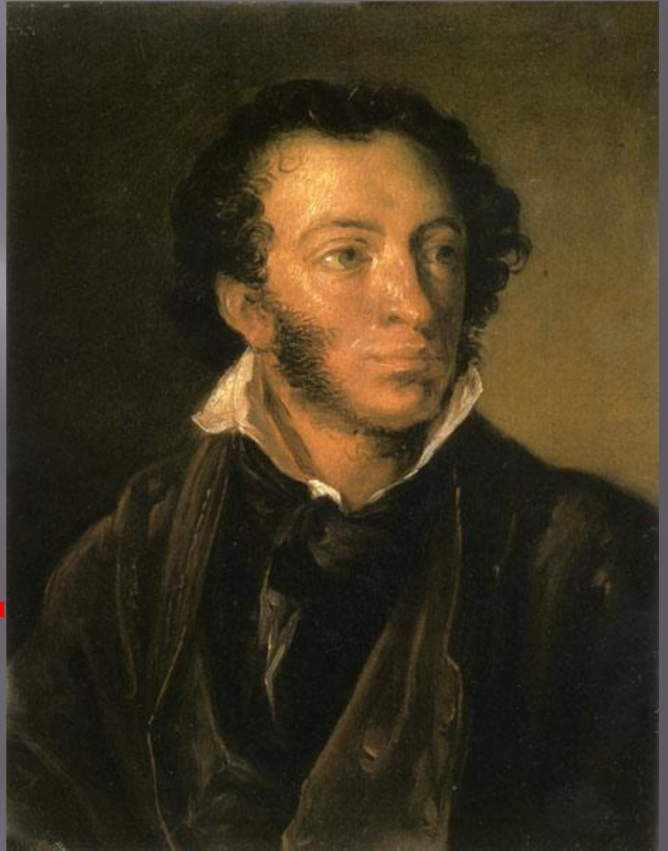
Тропинин В. А. Портрет А.С. Пушкина Эскиз. 1827. Всесоюзный музей А.С. Пушкина