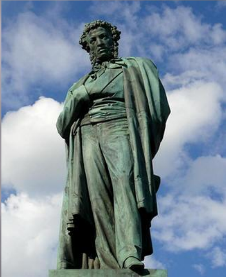
□ Памятник Пушкину в Москве.