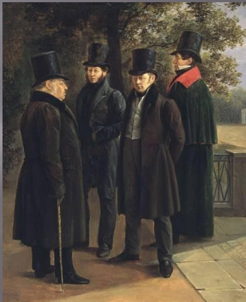
Г.Г. Чернецов. Крылов, Пушкин, Жуковский и Гнедич в Летнем саду. 1832