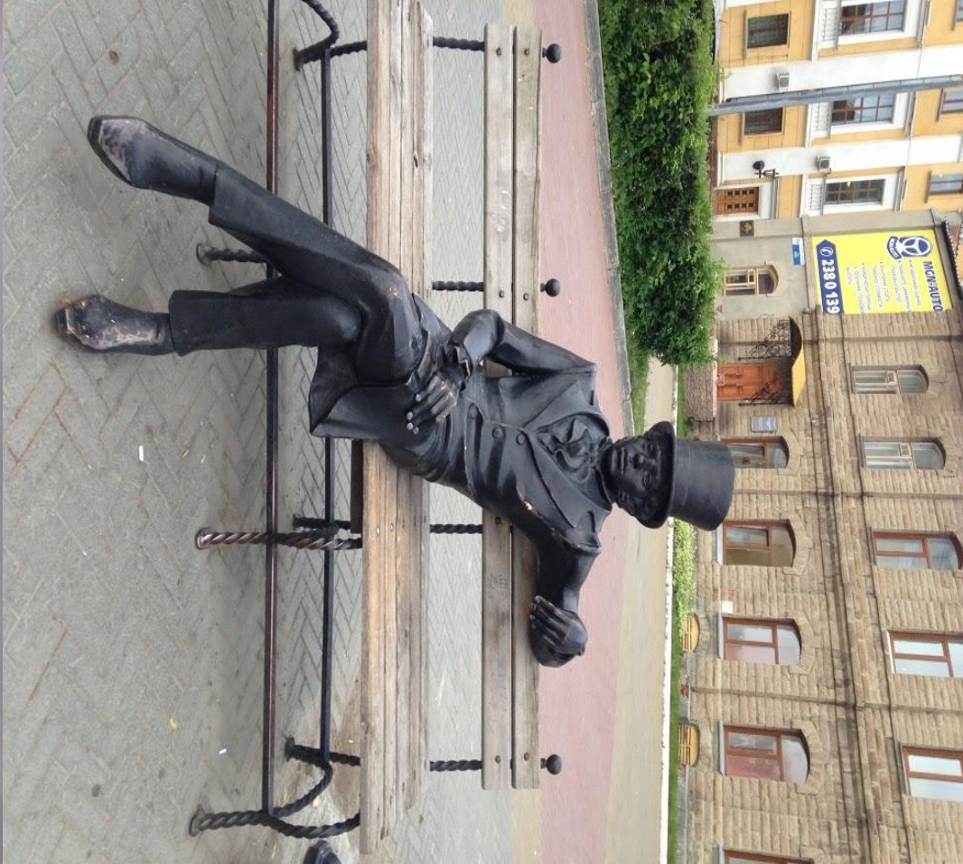
▣ А.С.Пушкин Скульптура в Челябинске.