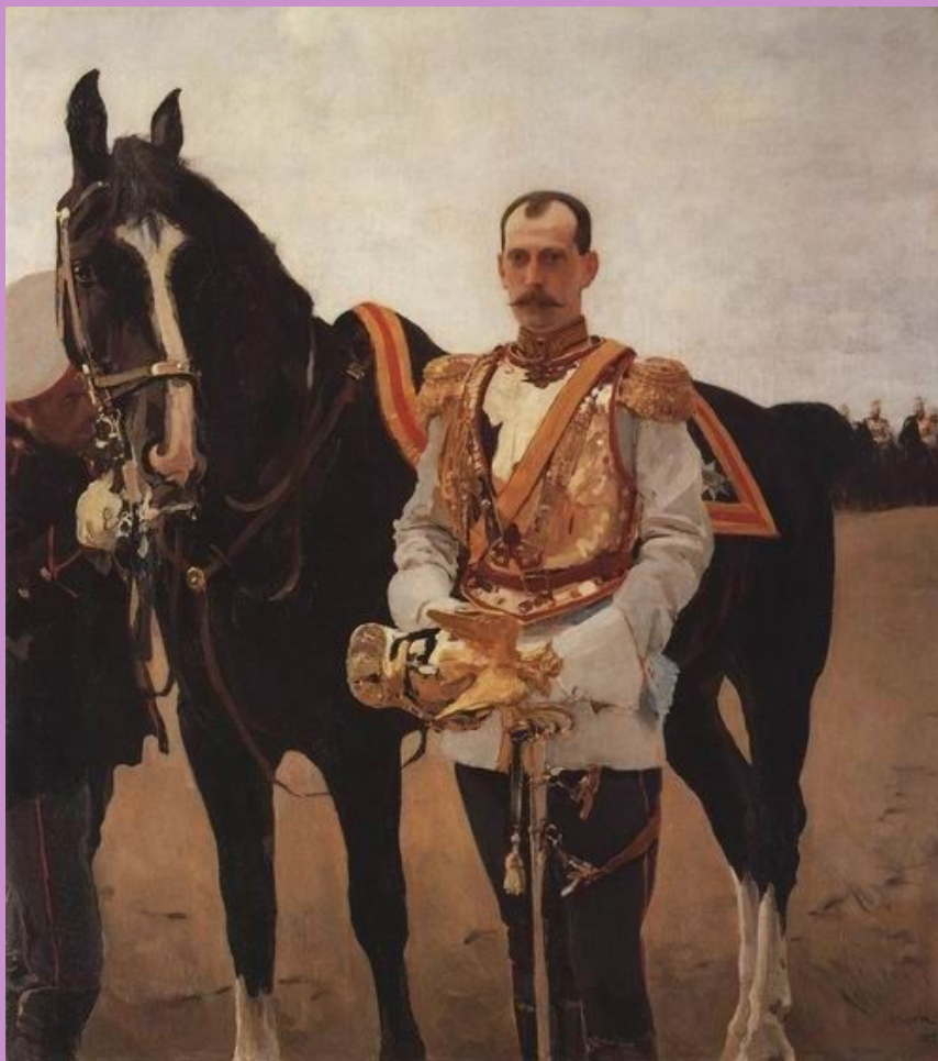
Портрет великого князя Павла Александровича