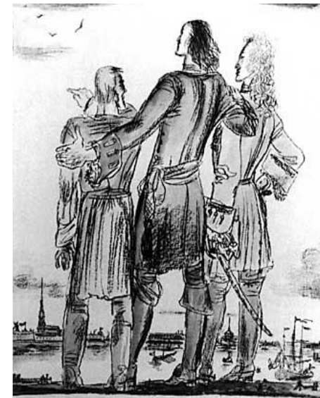
«Петр Великий» - «Король-самой. Долой же поваров, земной рай...»