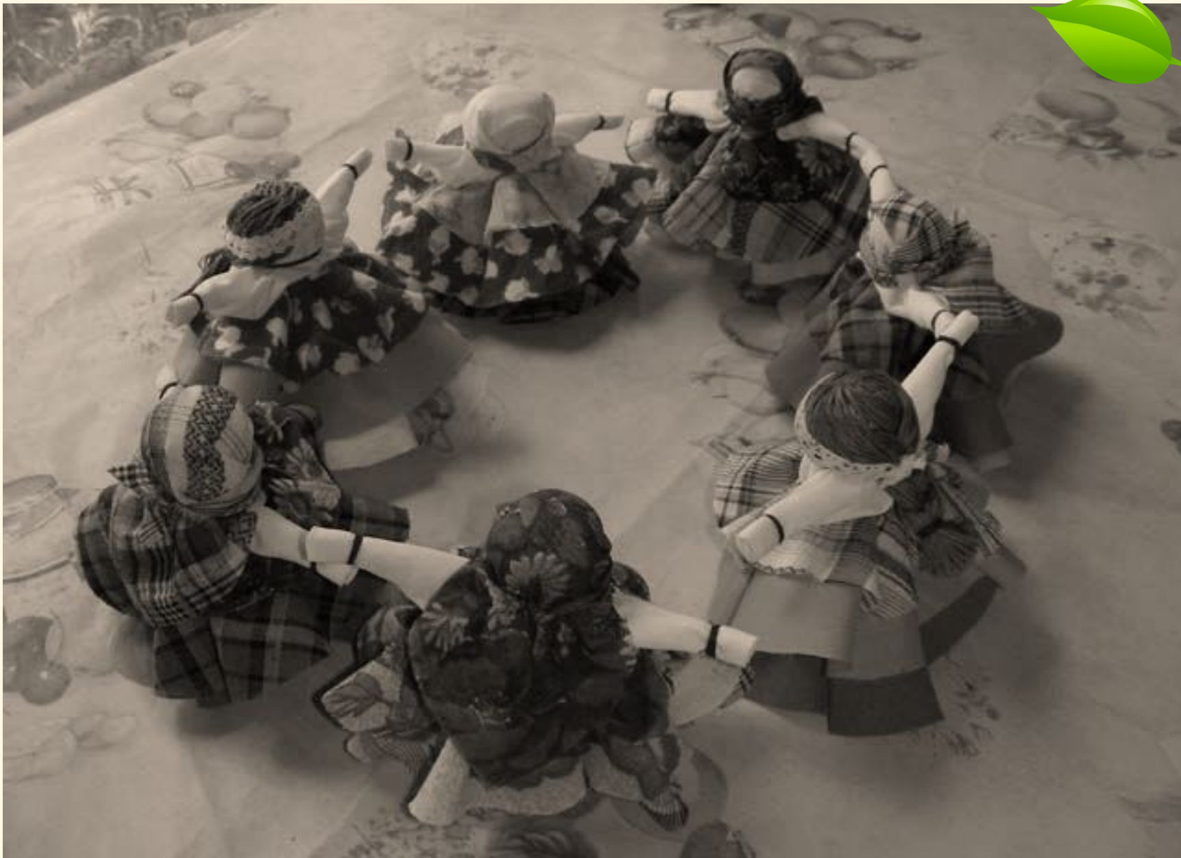
► Изготовление куколок-оберегов