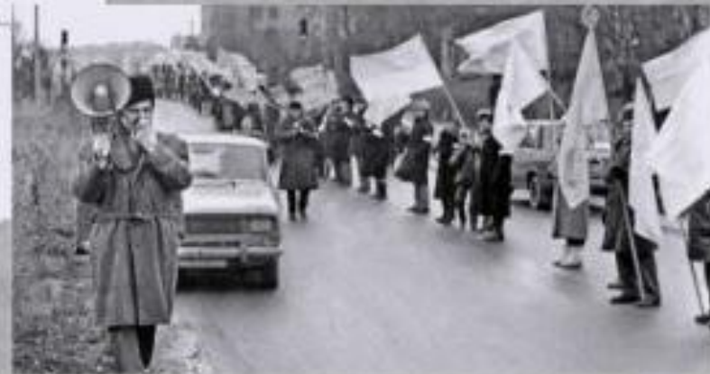
Напередодні Дня Соборності, у неділю, мільйони патріотів стали, взявшись за руки, сполучивши Київ, Львів та Івано-Франківськ