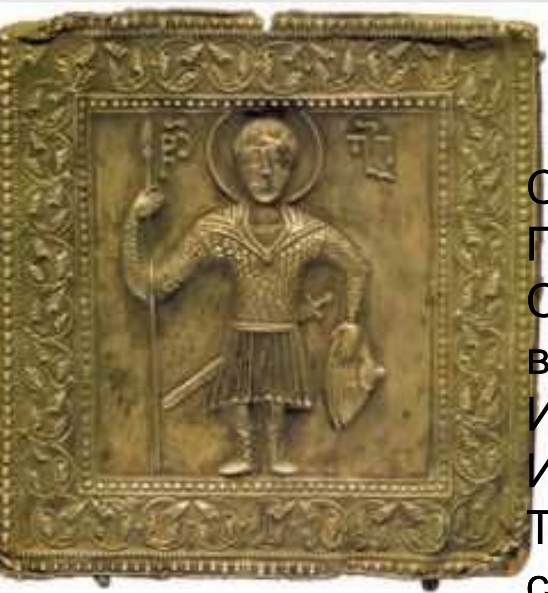
Св. Георгий Победоносец. Серебро, X - XI вв., Музей Изобразительных Искусств в Тбилиси, 19 x 18,5 см.