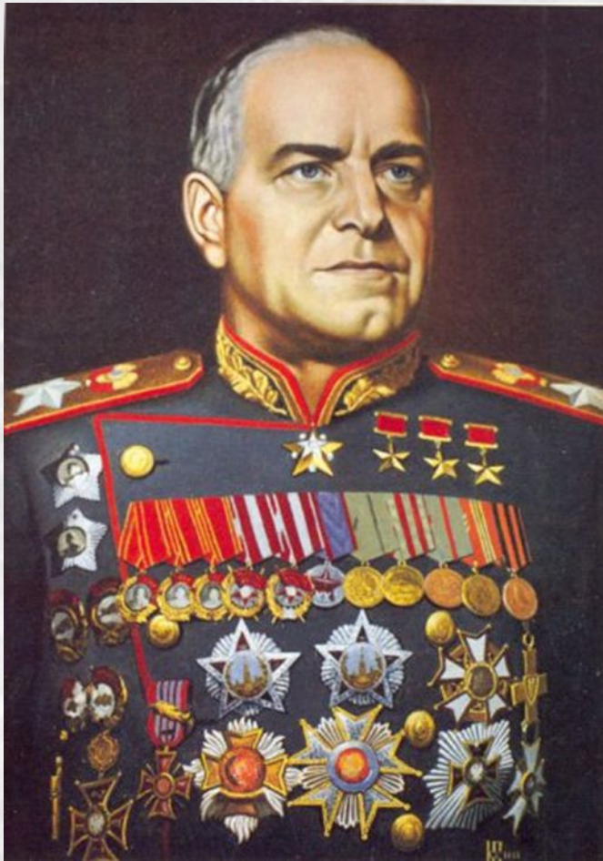
Георгий Константинович Жуков

В русском языке имя Георгий имеет еще две формы: Егорий и Юрий. Считается, что тот, кто носит его, способен на самый невероятный подвиг.