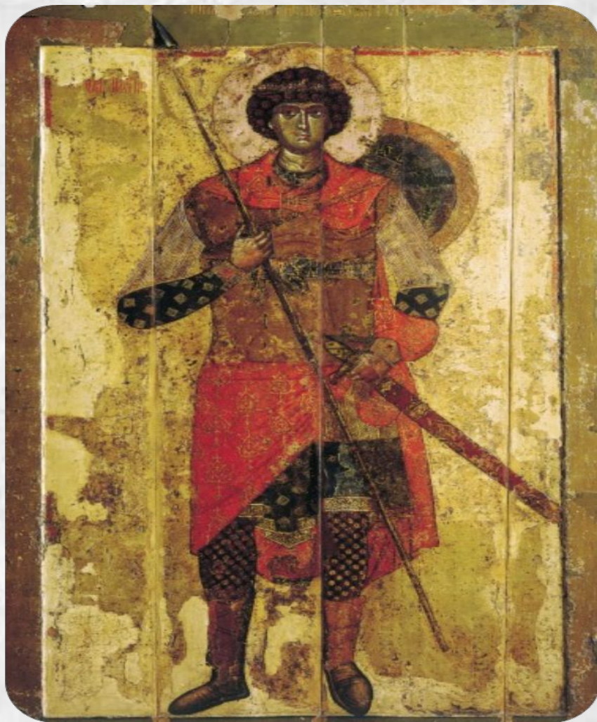
Икона. 1130 - 1140 гг. Новгород. ГТГ, Москва