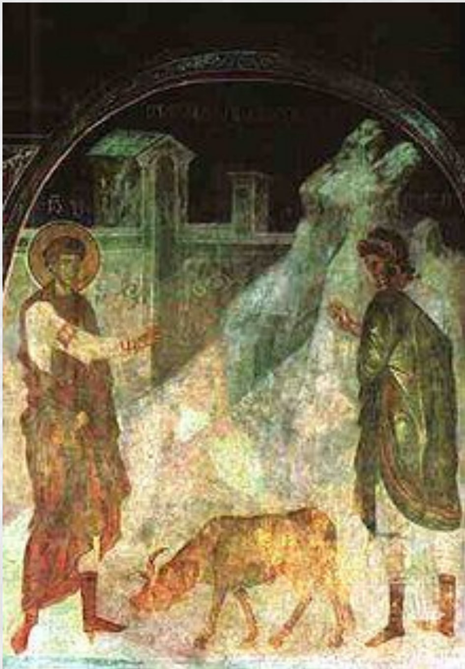
Дамиан. «Св. Георгий воскрешает павшего вола», Грузия