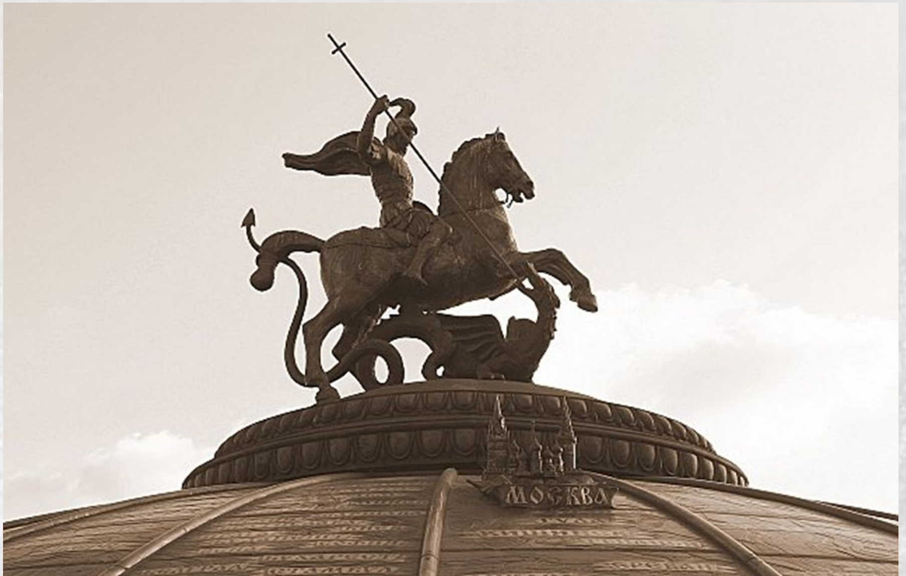
Зураб Церетели, Скульптура на Поклонной Горе, Москва