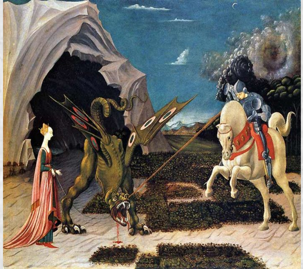
Паоло Уччелло . «Битва Св. Георгия со змием»

Как гласит предание, когда выпал жребий отдать на растерзание чудовищу царскую дочь, явился Георгий на коне и пронзил змея копьем, избавив царевну от смерти. Явление святого способствовало обращению местных жителей в христианство.