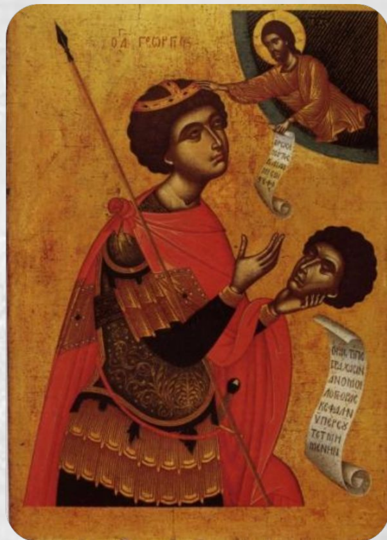
Св. Георгий с усеченной главой. XVI в. ГИМ, Москва

Великомученика Георгия за мужество и за духовную победу над мучителями, которые не смогли заставить его отказаться от христианства, а также за чудодейственную помощь людям в опасности — называют еще Победоносцем.