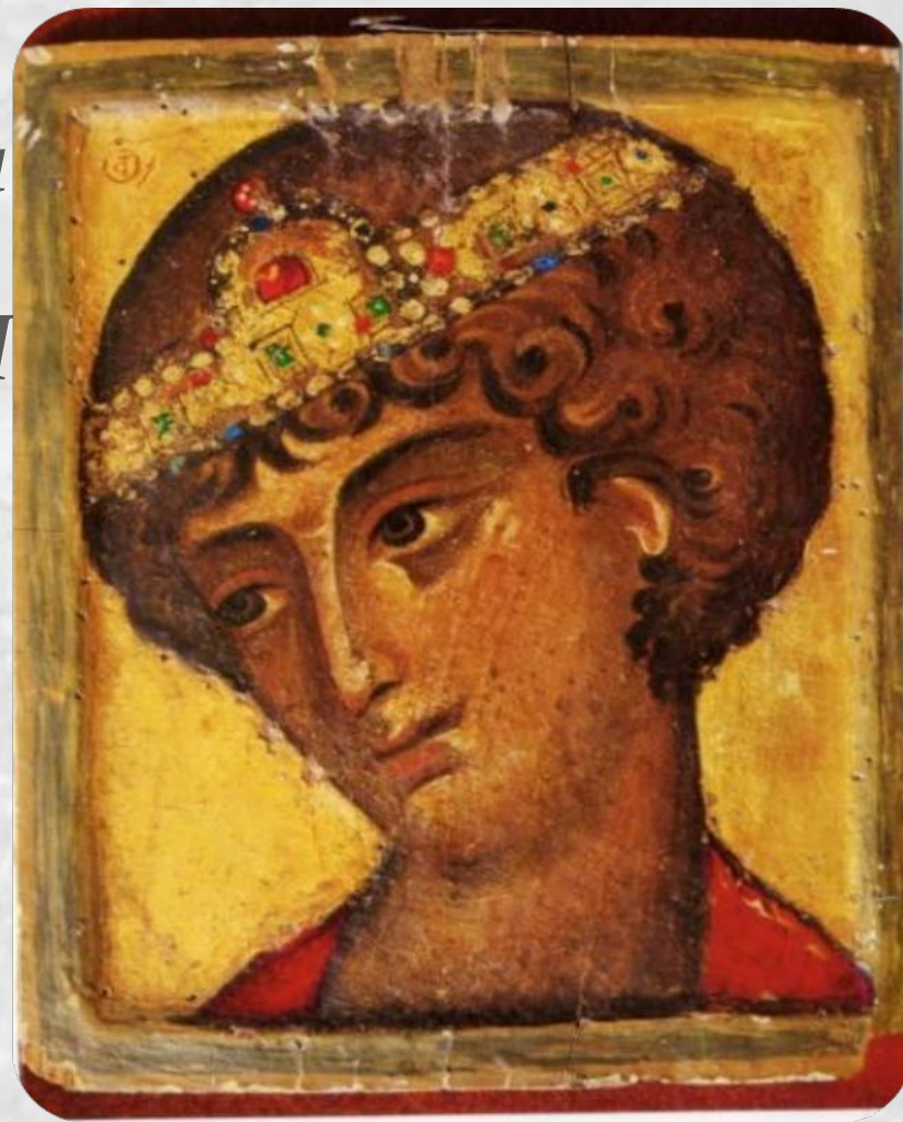
Св. Георгий оплечный. Кон. XII - нач. XIII в. Монастырь св. Екатерины на горе Синай