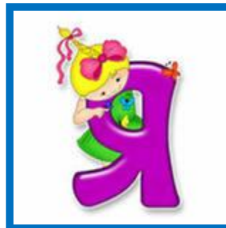
Буква не - А