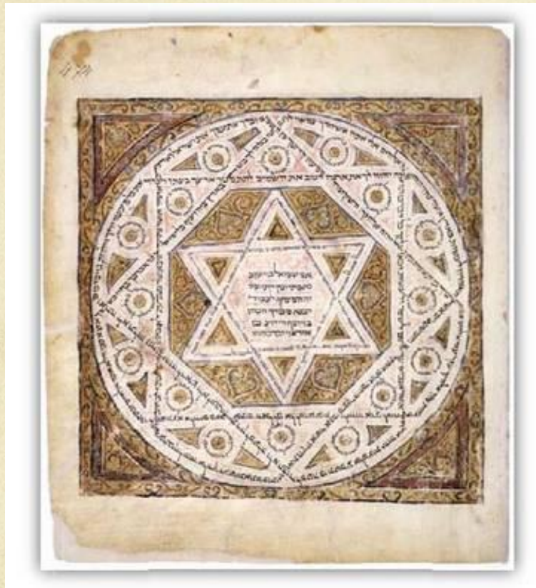
Иудаизм – религия евреев.

Развитые сложные религии, исповедовать которые может только представитель данного народа.