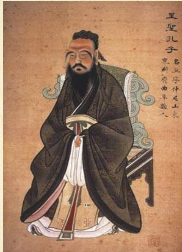
Конфуцианство – религия китайцев.