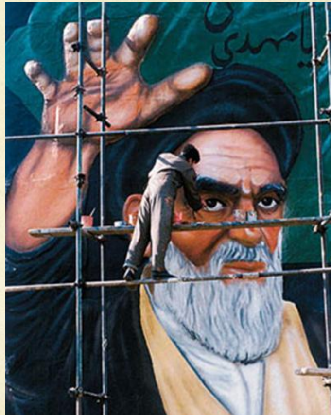
Аятолла Хомейни Религиозный лидер Ирана.