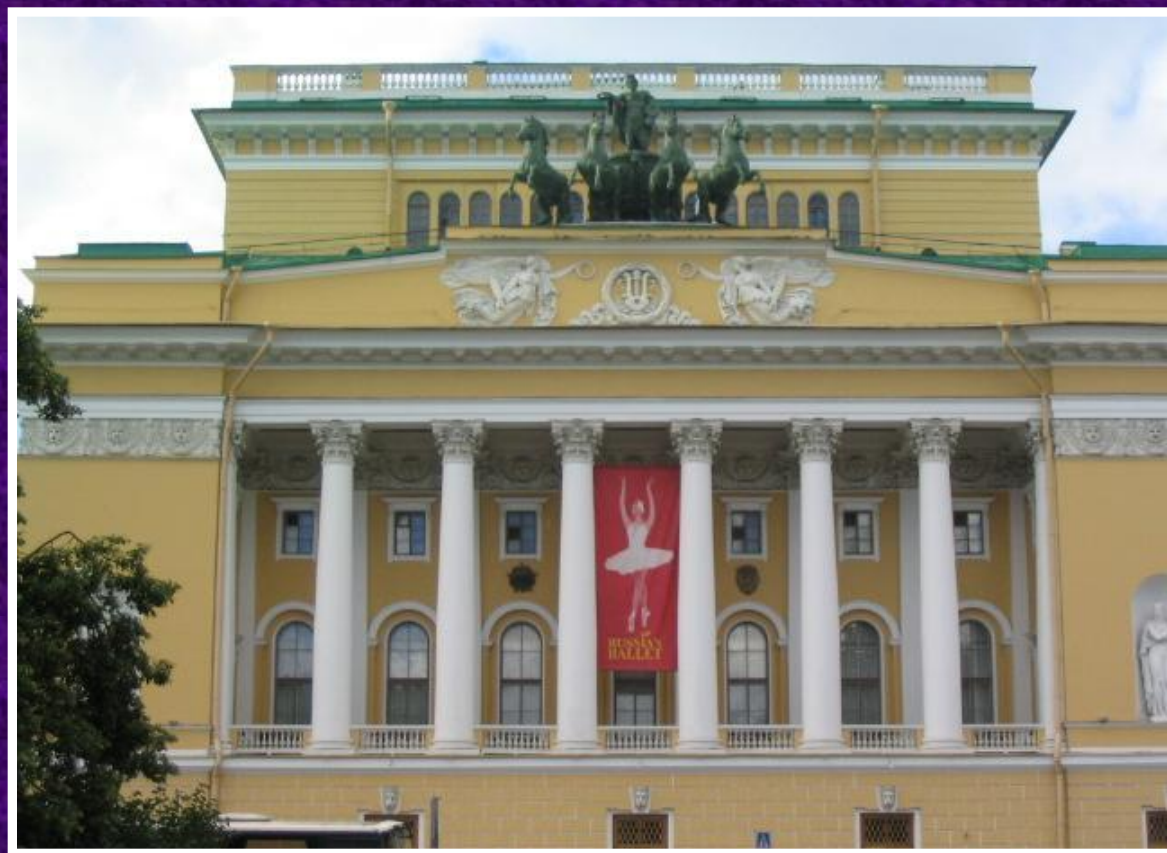
Александринский театр 1828 – 1832 гг. Санкт-Петербург