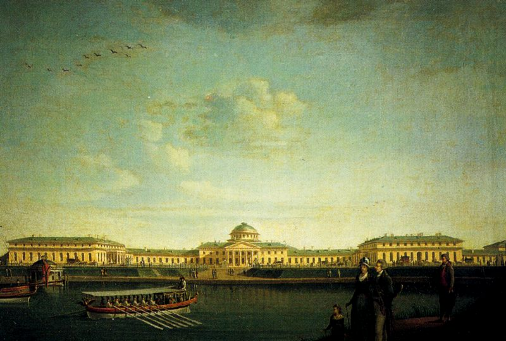
Таврический дворец, Старов И. Е.