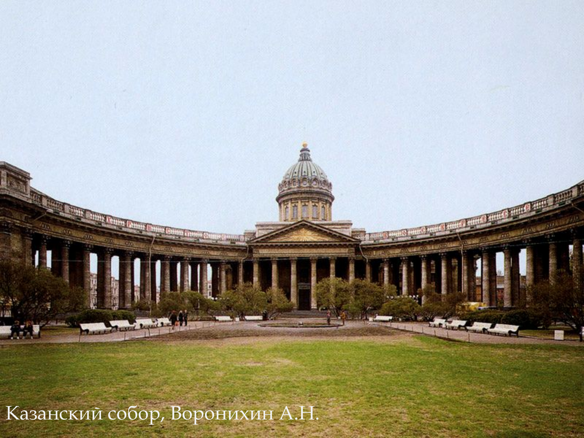
Казанский собор, Воронихин А.Н.