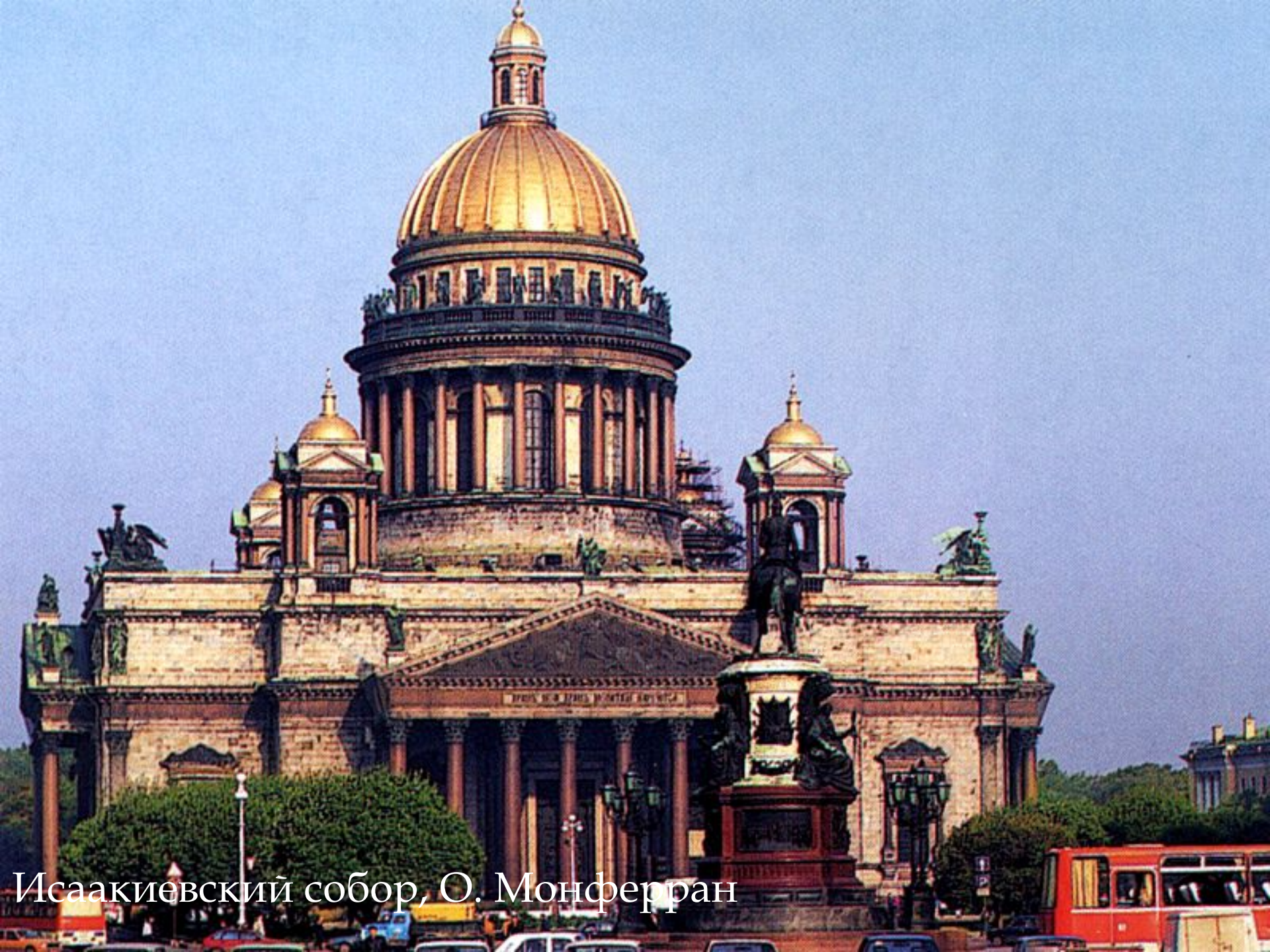
Исаакиевский собор, О. Монферран