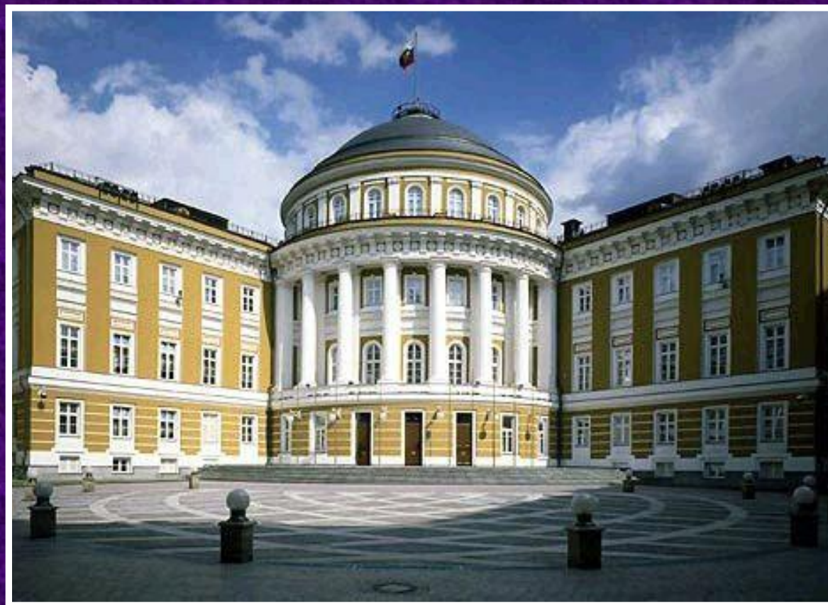
Здание Сената в московском Кремле (1776—1787)