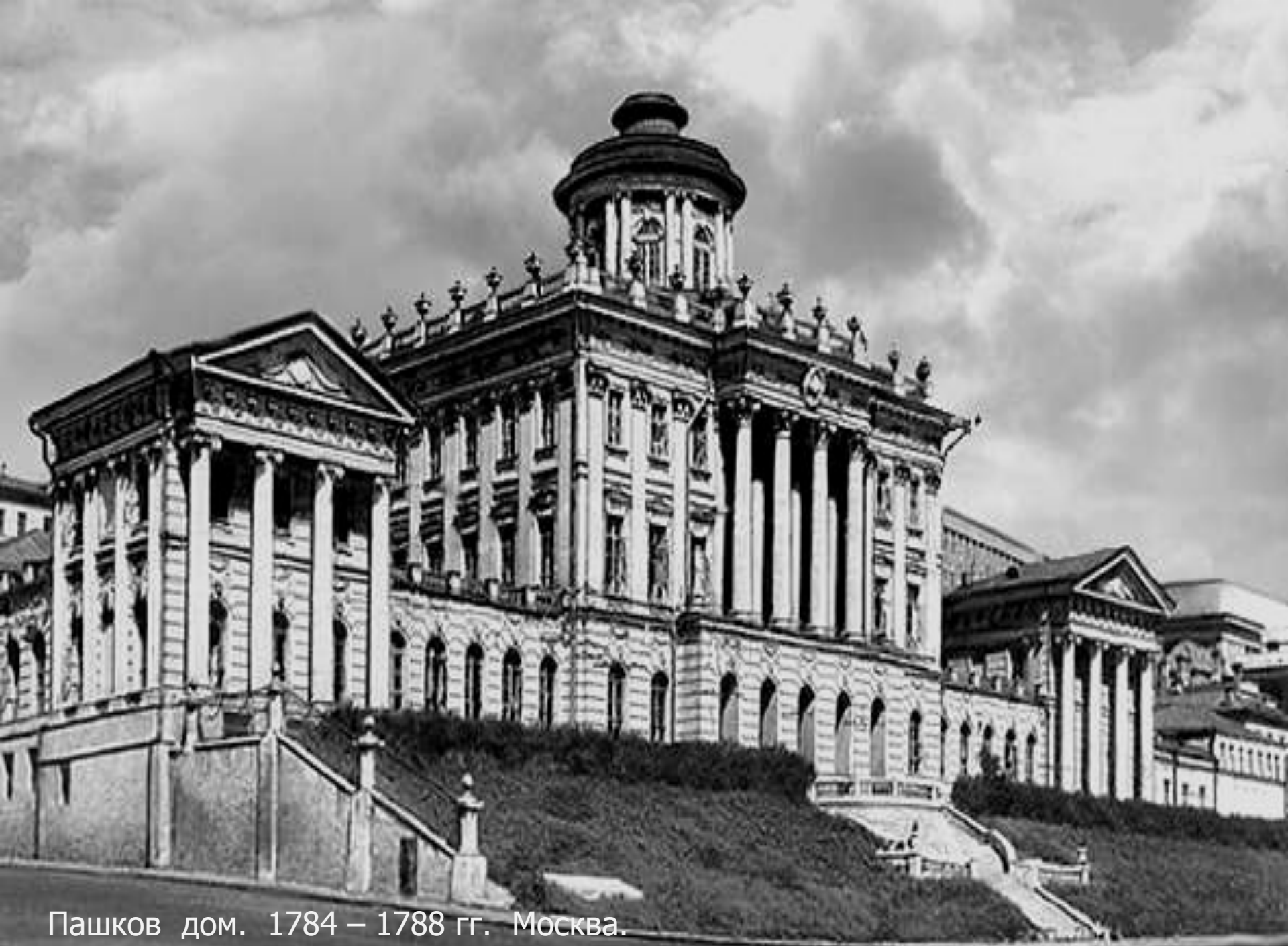
Пашков дом. 1784 – 1788 гг. Москва.