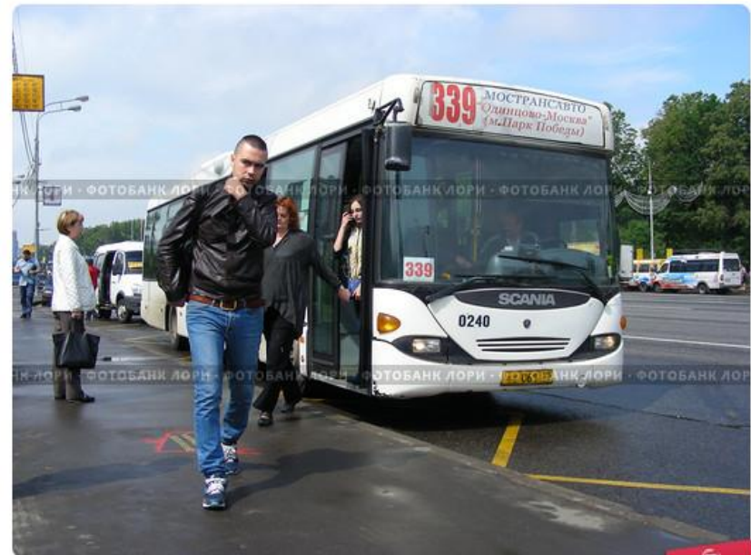
Высадка пассажиров из автобуса № 339 "Одинцово-Москва". Кутузовский пр